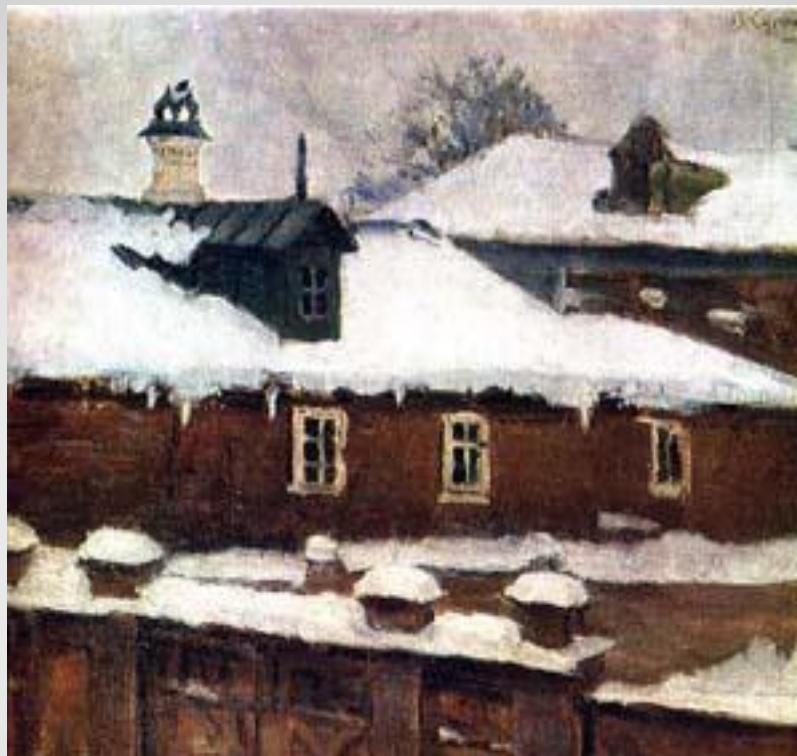
В.И.Суриков. Крыши зимой. Этюд. 1880 г.