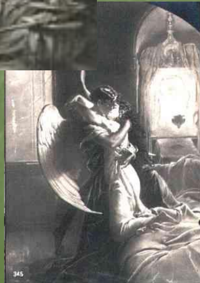
М. Зичи. Демонъ и Тамара (Поцѣлуе).