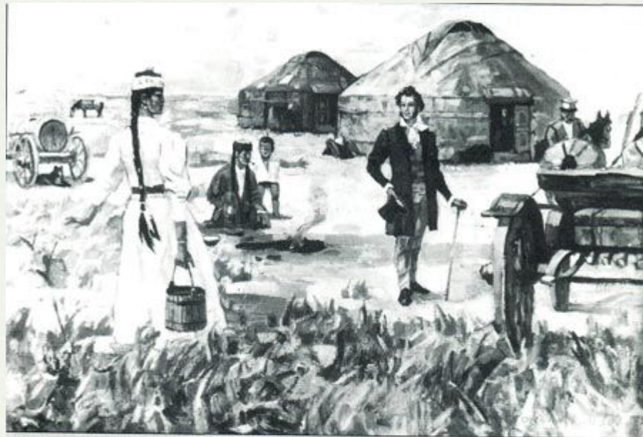
Прощай, любезная калмычка 1983. х. м. 80x120 см. КГУ