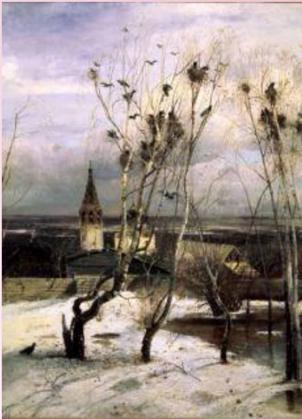
А.К. Саврасов «Грачи прилетели»