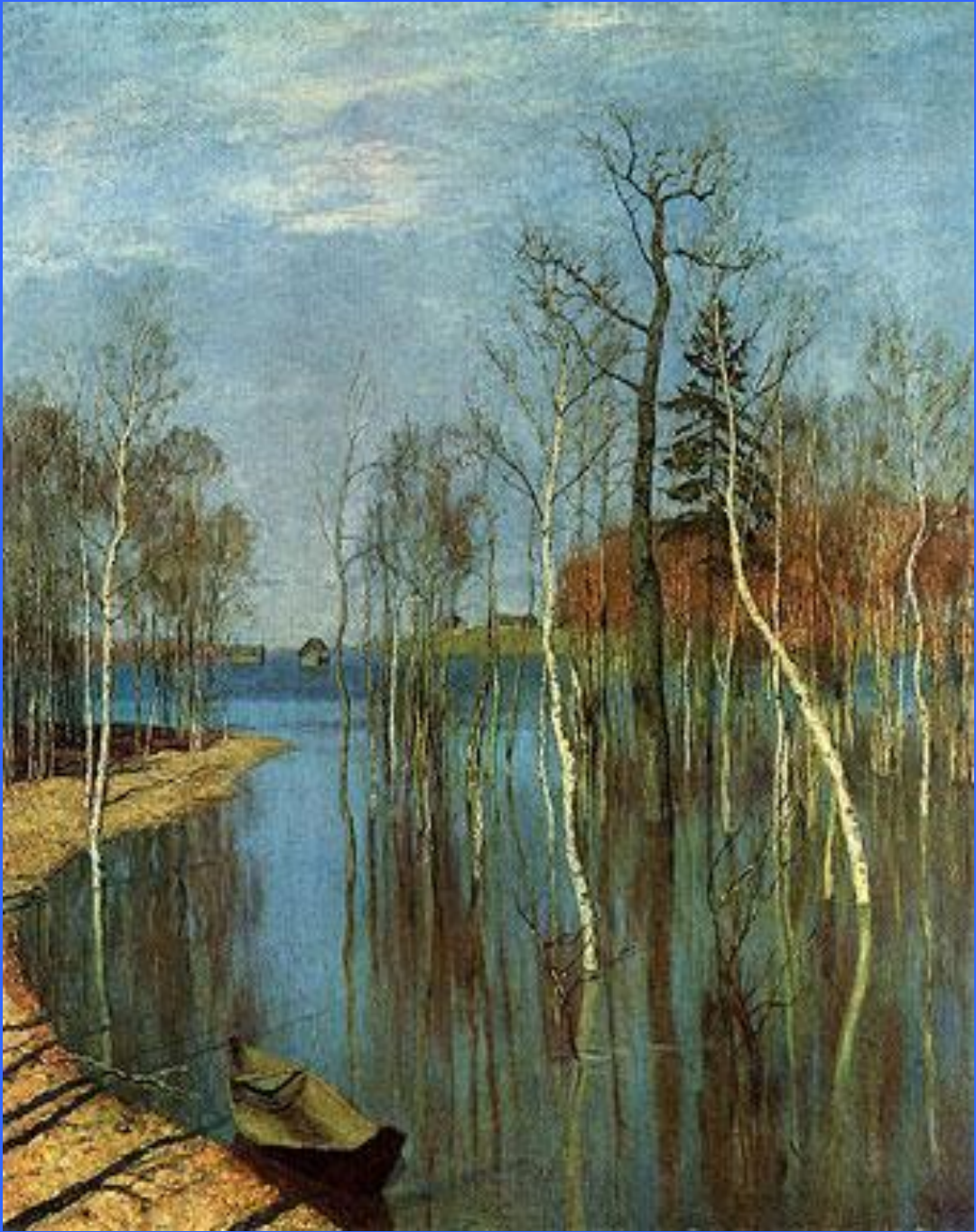
И.И. Левитан «Большая вода»