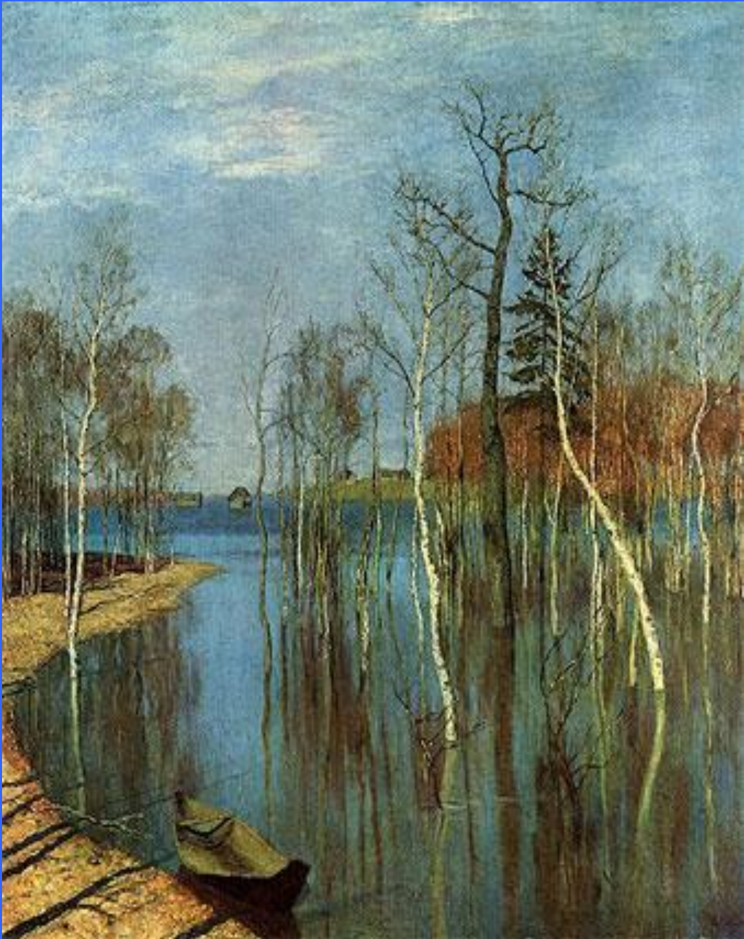
И.И. Левитан «Большая вода»