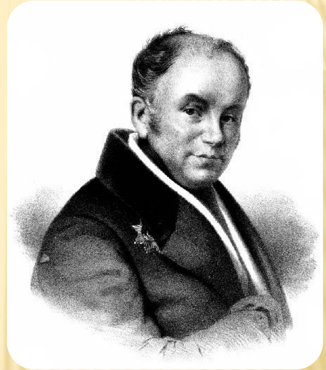
Афанасий Иванович Бунин