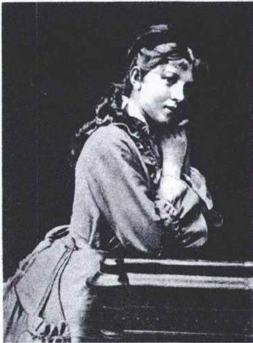
А.А. БЛОК (мать поэта).