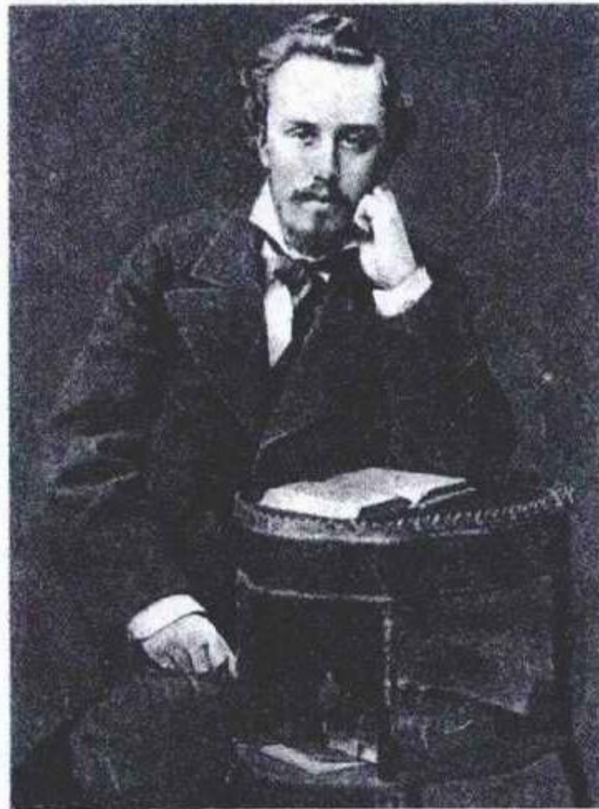
А.Л. БЛОК (отец поэта).