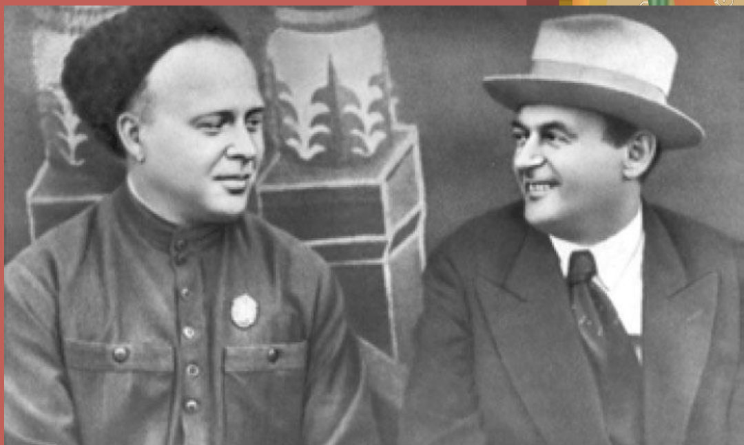
Р. Фраерман с А. Гайдаром