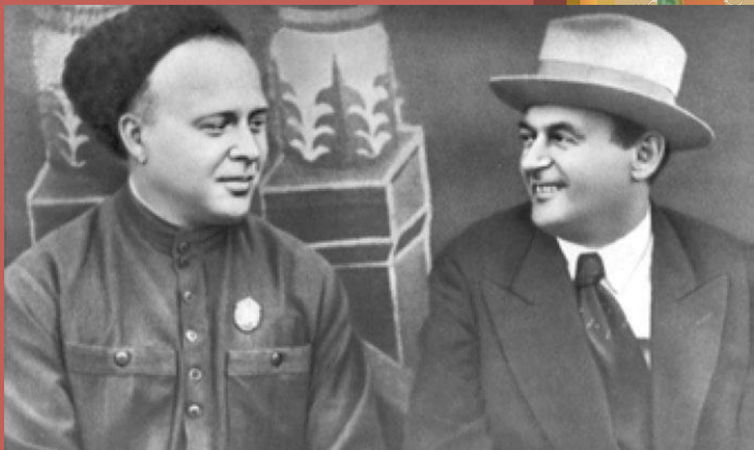
Р. Фраерман с А. Гайдаром