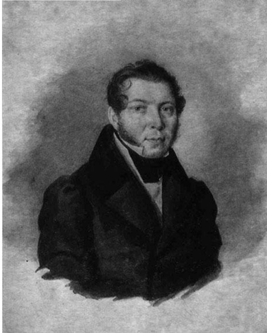
Студент Казанского императорского университета Сергей Аксаков.