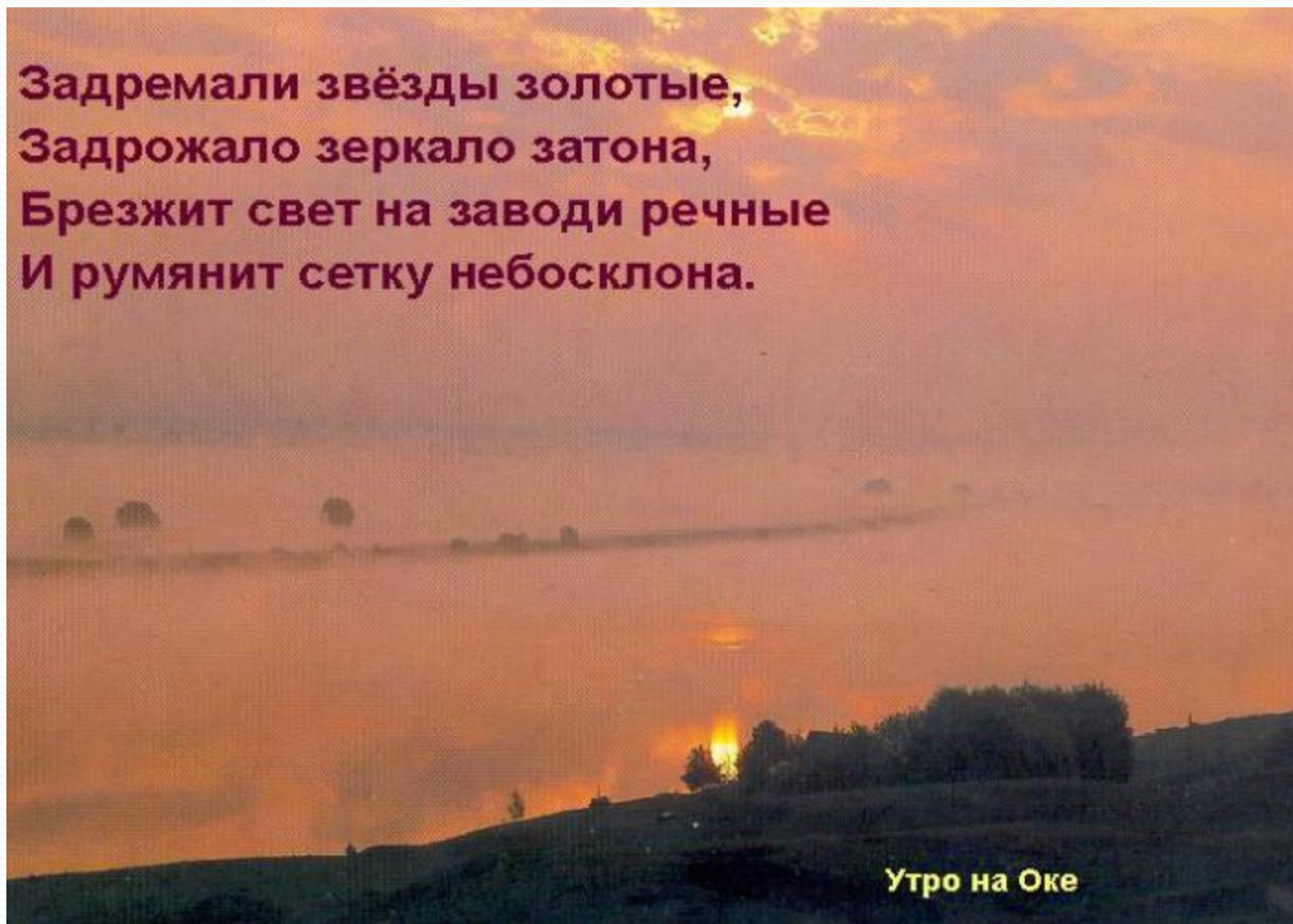
Утро на Оке

Задремали звёзды золотые, Задрожало зеркало затона, Брезжит свет на заводи речные И румянит сетку небосклона.