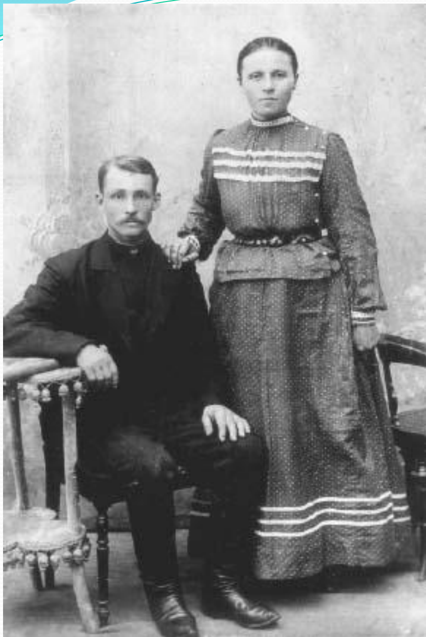
Александр Никитич и Татьяна Федоровна – родители С. Есенина