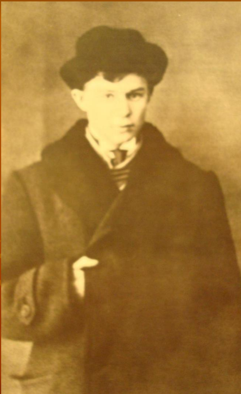
С.Есенин. 1912-13 гг.