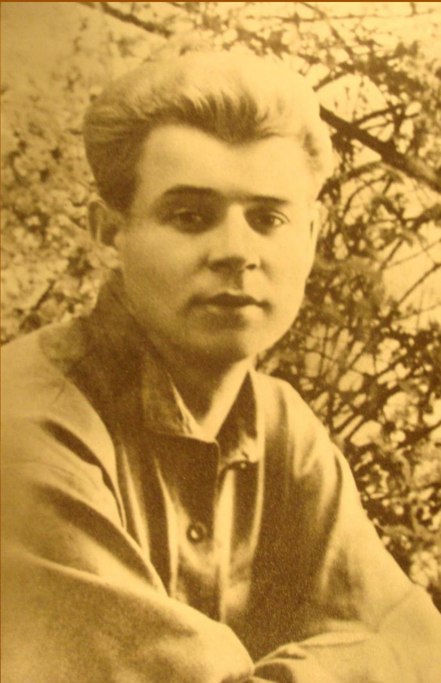
С.А.Есенин 1924 г.