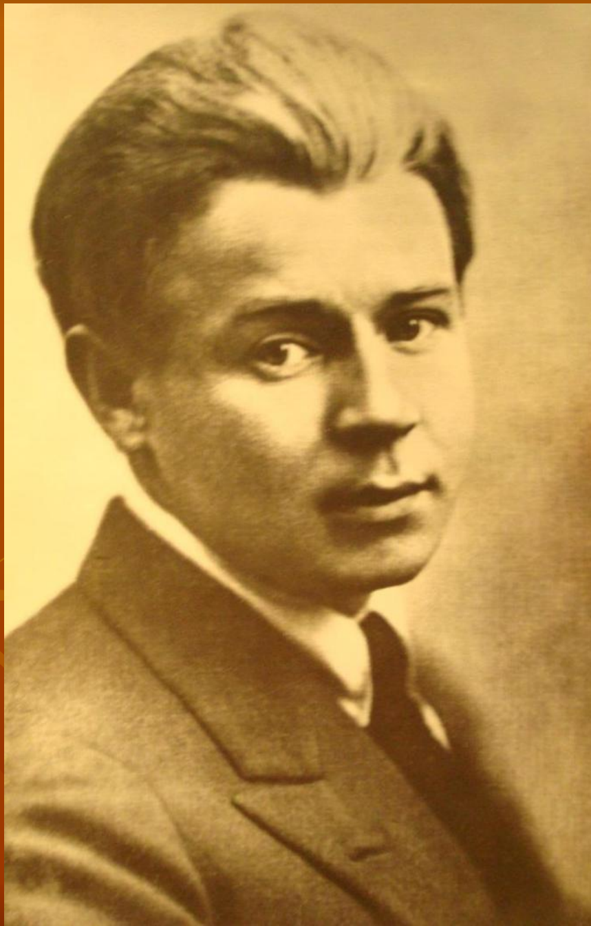
С.Есенин. 1925 г.