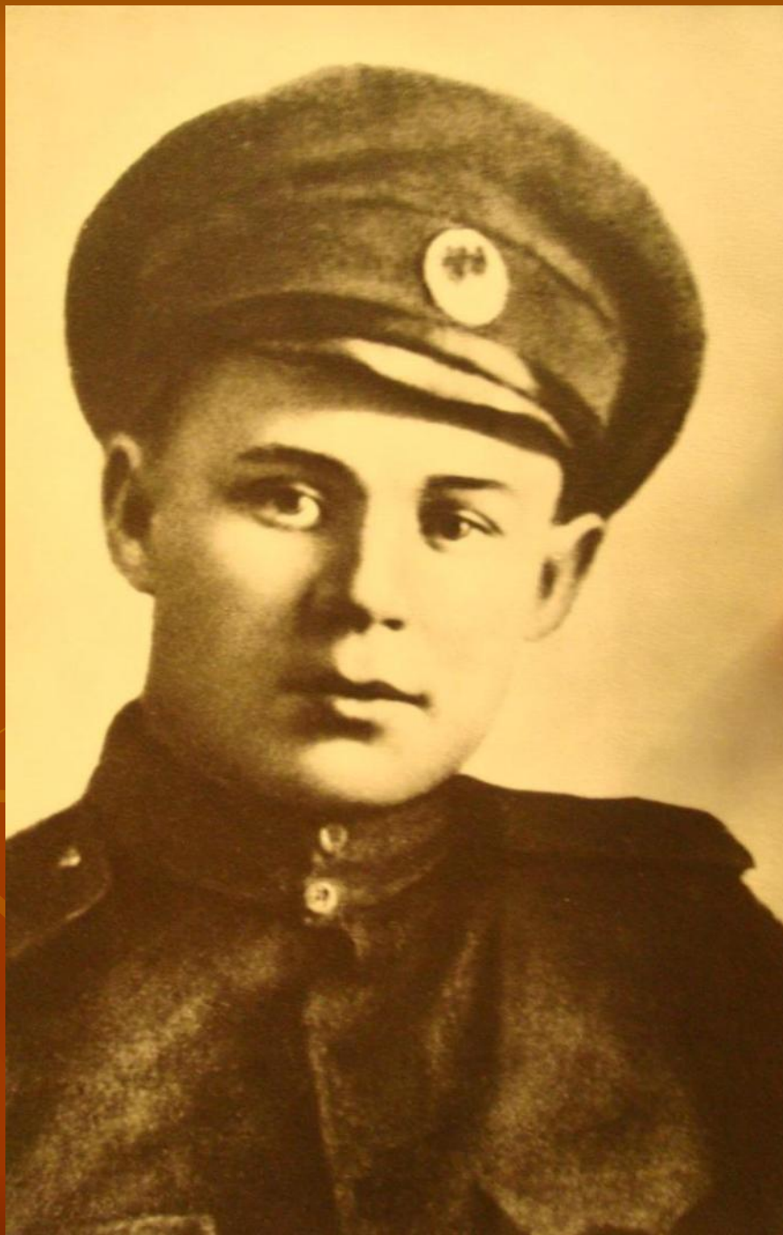
С.Есенин. 1916 г.