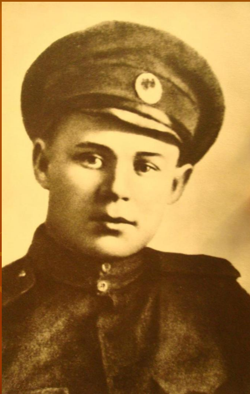
С.Есенин. 1916 г.