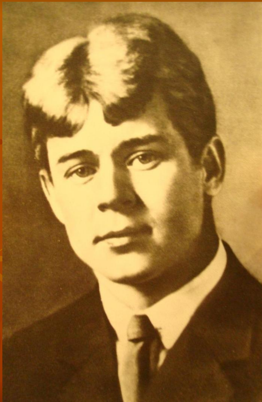
С.Есенин. 1922 г.