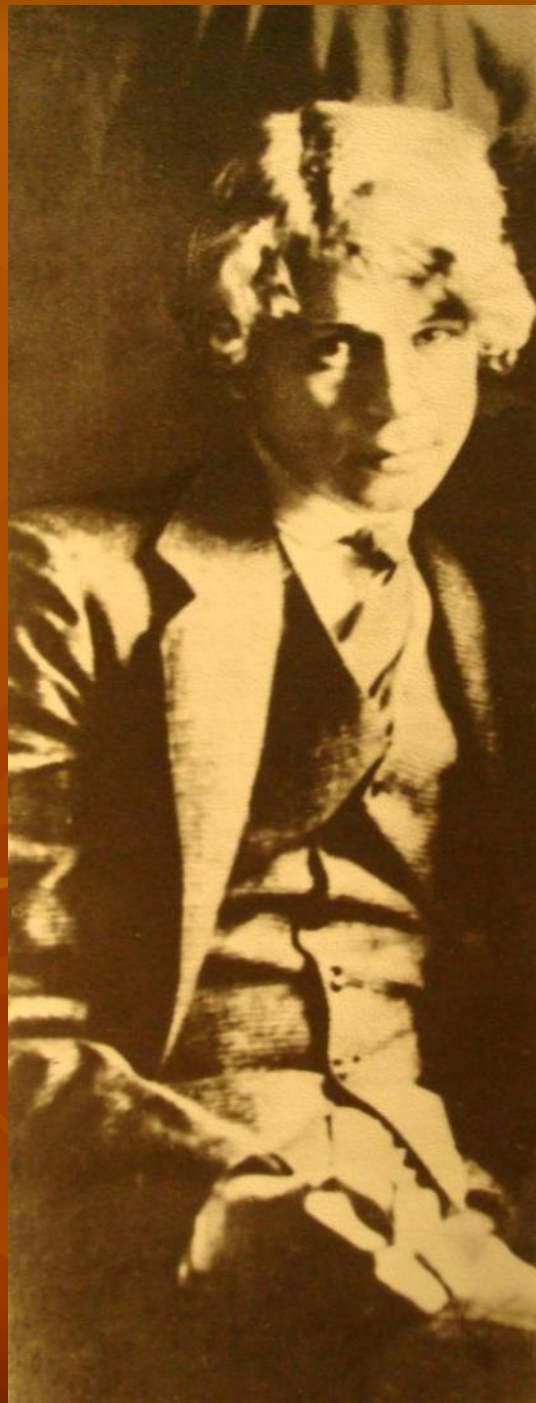
С.Есенин. 1914-15 гг.