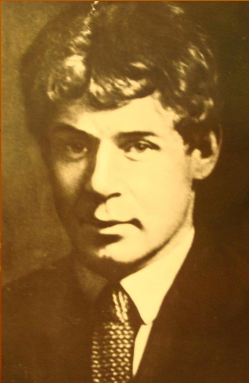
С.Есенин. 1922 г.