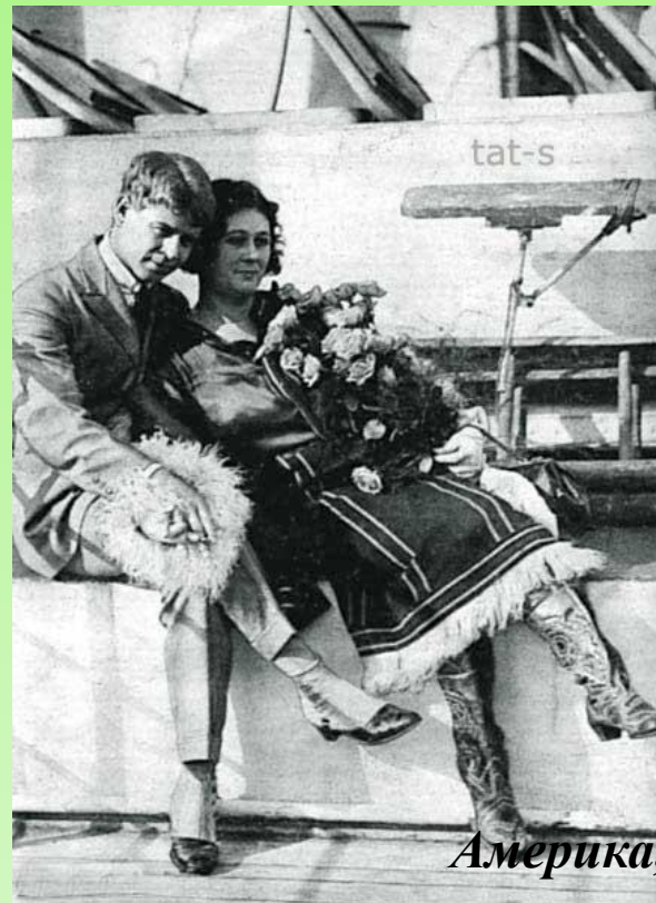
Америка, 1922 год