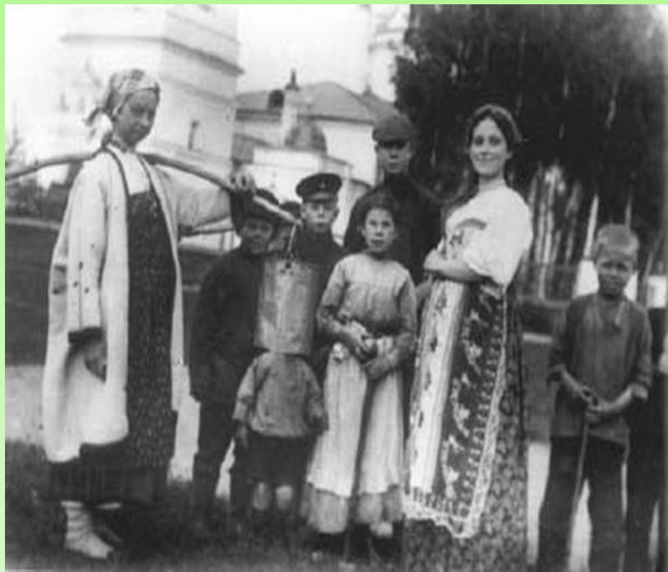
Жители села Константиново. Третий справа в кепке – Сергей Есенин