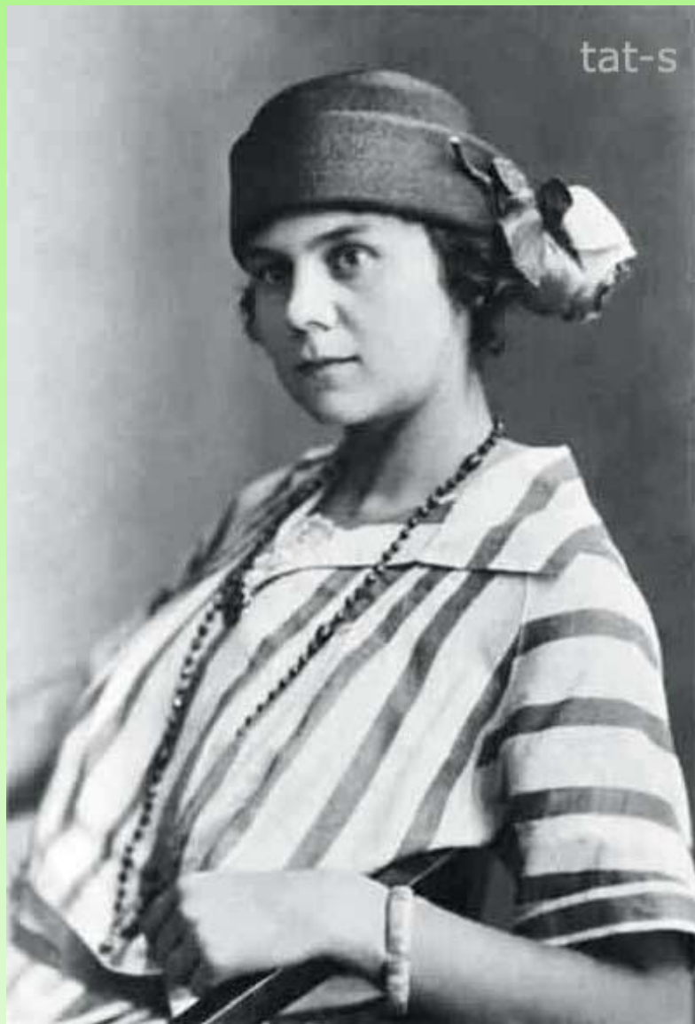
Галина Артуровна Бениславская, близкий друг Сергея Есенина, покончила с собой на его могиле (1897 - 1926)

4 ноября 1920 года на литературном вечере "Суд над имажинистами" Есенин познакомился с Галиной Бениславской. Их отношения с переменным успехом продлились до весны 1925 года. Вернувшись из Константинова, Есенин окончательно порвал с ней. Это было для нее трагедией. Оскорбленная и униженная Галина в своих воспоминаниях писала: "Из-за нескладности и изломанности моих отношений с Сергеем я не раз хотела уйти от него как женщина, хотела быть только другом. Но поняла, что от Сергея мне не уйти, эту нить не порвать...". Галина Бениславская застрелилась на могиле Есенина.