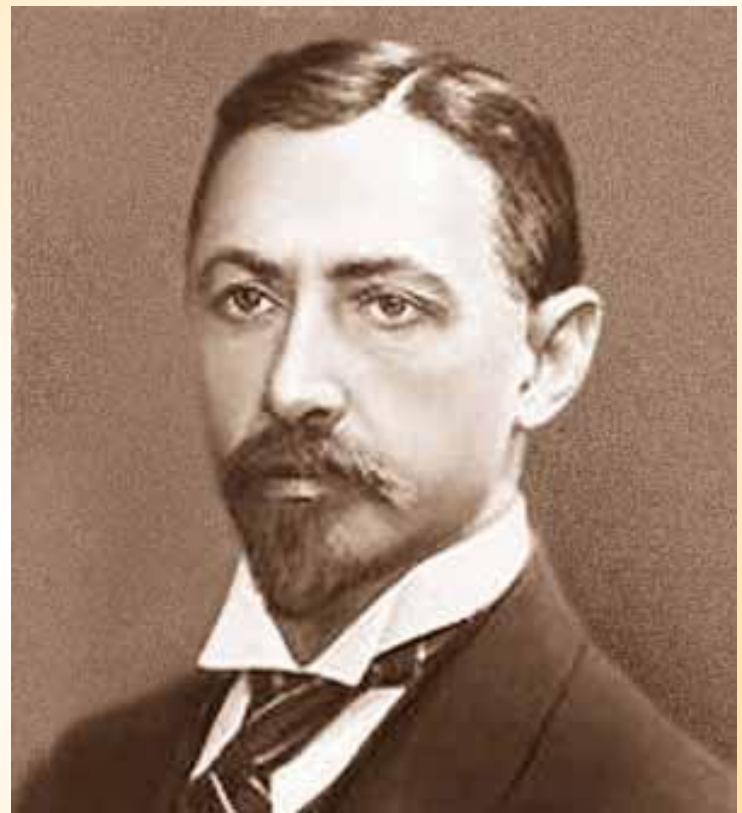
Иван Алексеевич БУНИН