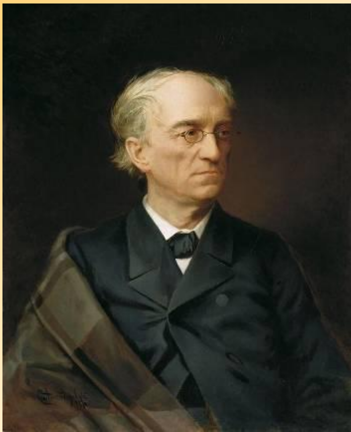
Фёдор Иванович ТЮТЧЕВ

Есть в осени первоначальной Короткая, но дивная пора- Весь день стоит как бы хрустальный, И лучезарны вечера.