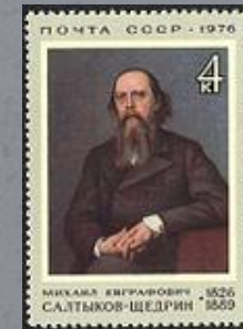
1958 г. Почтовая марка СССР