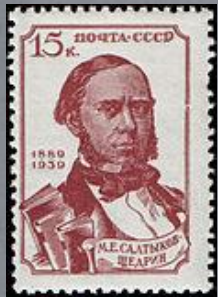
1939 г. 30 копеек

В СССР были выпущены почтовые марки, посвященные Салтыкову-Щедрину.