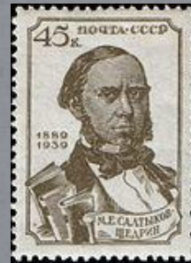
1939 г. 45 копеек