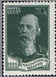
1939 г. 30 копеек