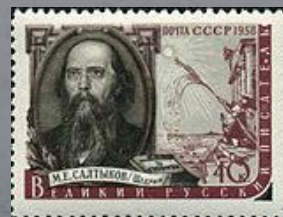
1976 г. Почтовая марка СССР