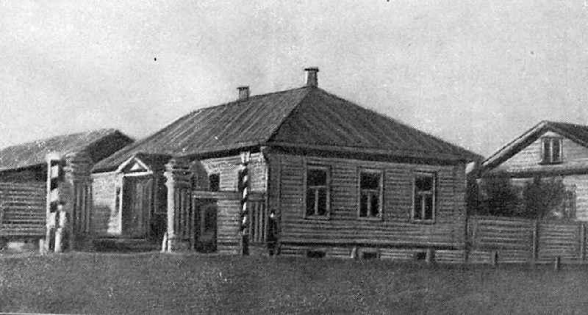
Дом в Вятке, где жил М.Е.Салтыков