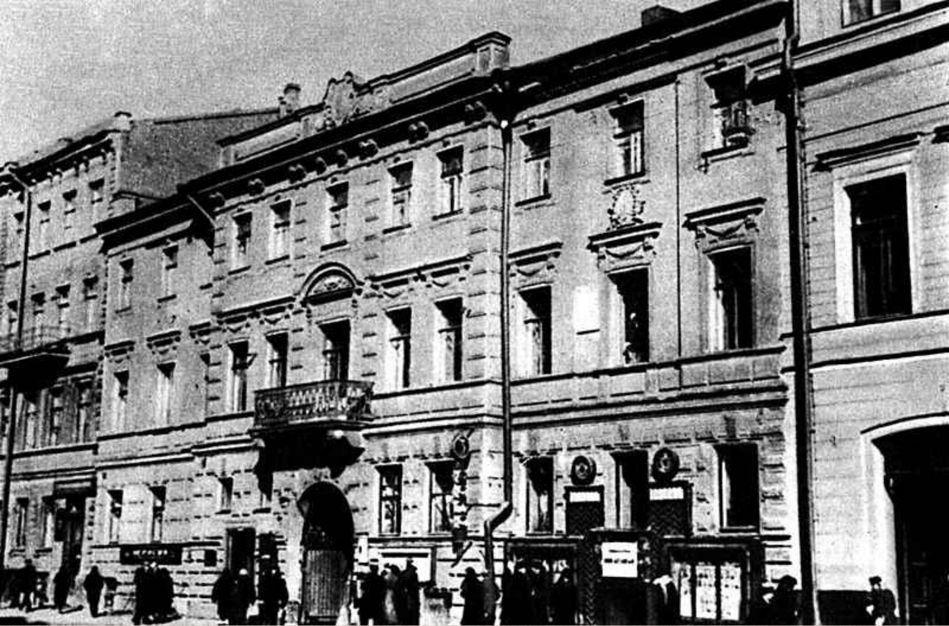
Дом в Петербурге, где жил М.Е.Салтыков