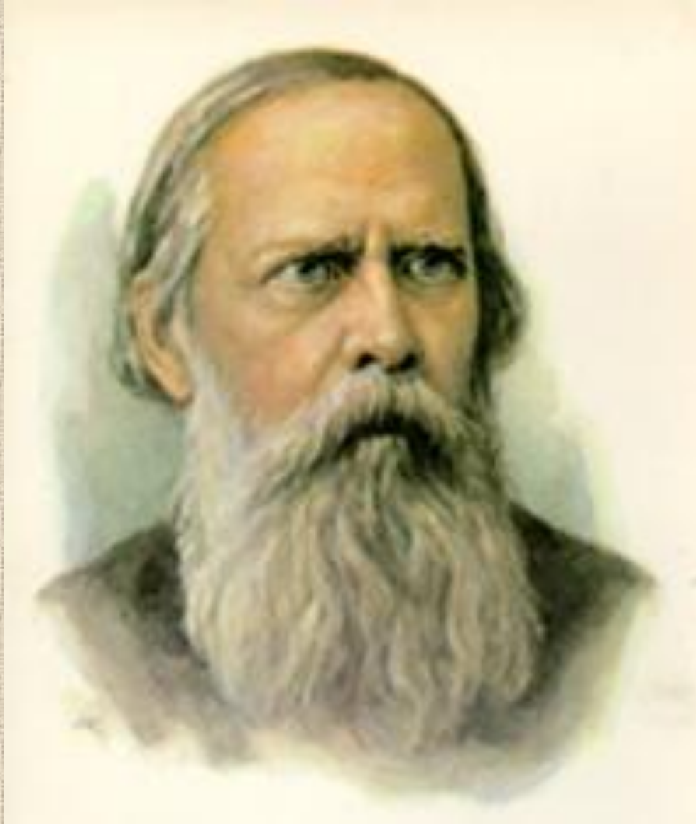
Салтыков-Щедрин (псевдоним - Н. Щедрин) Михаил Евграфович (1826 - 1889), прозаик.