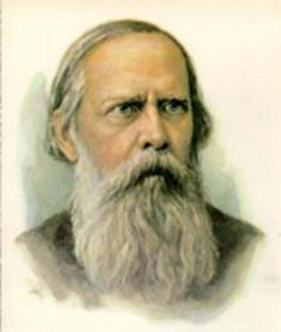
Салтыков-Щедрин (псевдоним - Н. Щедрин) Михаил Евграфович (1826 - 1889), прозаик.