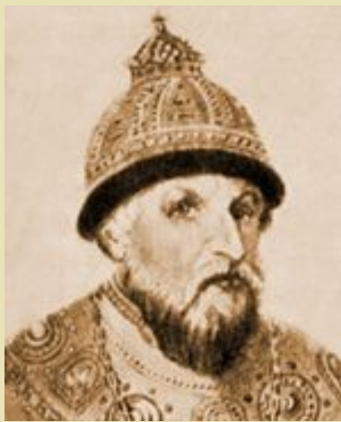
Иоанн IV Грозный

(Эпиграмма на М.С.Рыбушкина, автора трагедии «Иоанн, или Взятие Казани»)