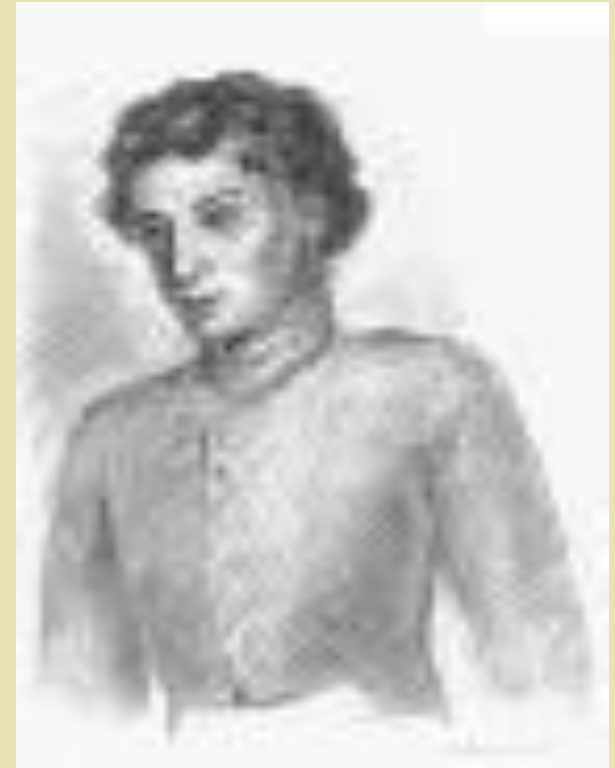
А.С.Пушкин в лицейские годы.

Арзамасец Ф.Вигель писал в своих воспоминаниях: "Да как же не быть либералом восемнадцатилетнему мальчику, который только что вырвался на волю, с пылким поэтическим воображением, кипучею африканскою кровью в жилах, и в такую эпоху, когда свободомыслие было в самом разгаре".