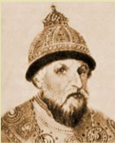
Иоанн IV Грозный

(Эпиграмма на М.С.Рыбушкина, автора трагедии «Иоанн, или Взятие Казани»)