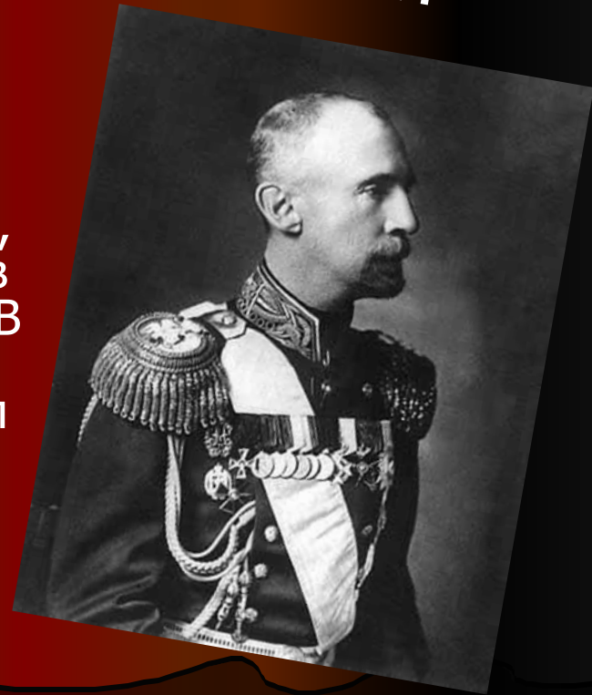
Великий Князь Дмитрий Константинович

Антио́х Дми́триевич Кантеми́р — знаменитый русский поэт-сатирик и выдающийся дипломат своего времени, деятель раннего русского Просвещения. Наиболее крупный русский поэт силлабической эпохи. Младший сын молдавского господаря, князя Дмитрия Константиновича, всецело посвятил себя мирной деятельности. Родился в Молдавии, Получил превосходное домашнее образование, дополненное кратковременным пребыванием в Греко-славянской академии и Академии Наук. В 18 лет Кантемир был избран в Российскую Академию Наук. 1 января 1732 Кантемир уехал за границу, чтобы занять пост русского резидента в Лондоне. состоял первоначально (до 1738) представителем России в Лондоне, а затем в Париже. Кантемир скончался 31 марта (11 апреля) 1744 в Париже и погребен в Московском Никольском греческом монастыре.