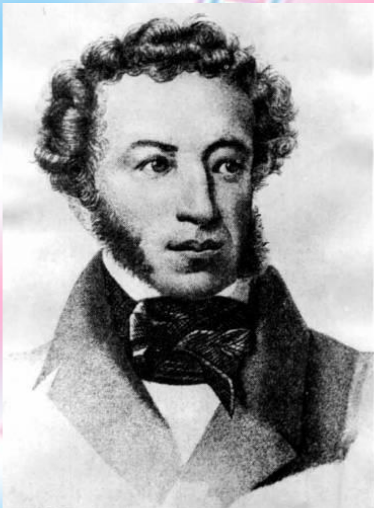
Портрет А.С.Пушкина 1833 года.

Вечером слушаю сказки – и вознаграждаю тем недостатки своего воспитания. Что за прелесть эти сказки! Каждая есть поэма!