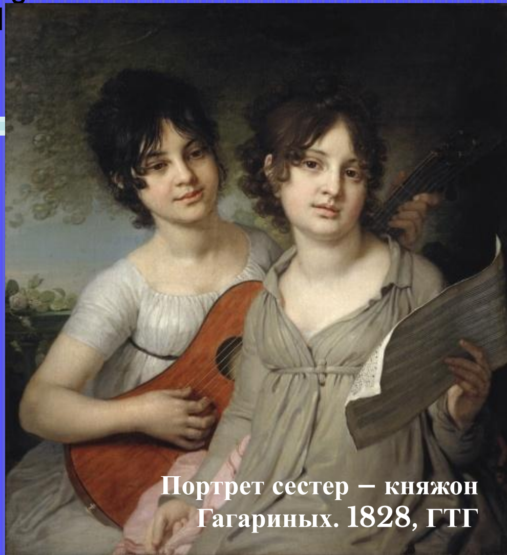
Портрет сестер – княжон Гагариных. 1828, ГТГ

В начале 1790-х Боровиковский обратился к жанру камерного портрета, чаще всего изображая женщин в домашней обстановке.