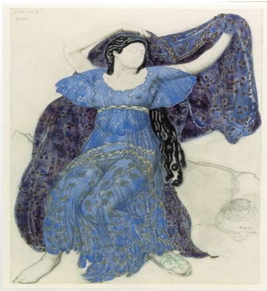
Л.Бакст Эскиз костюма нимфы