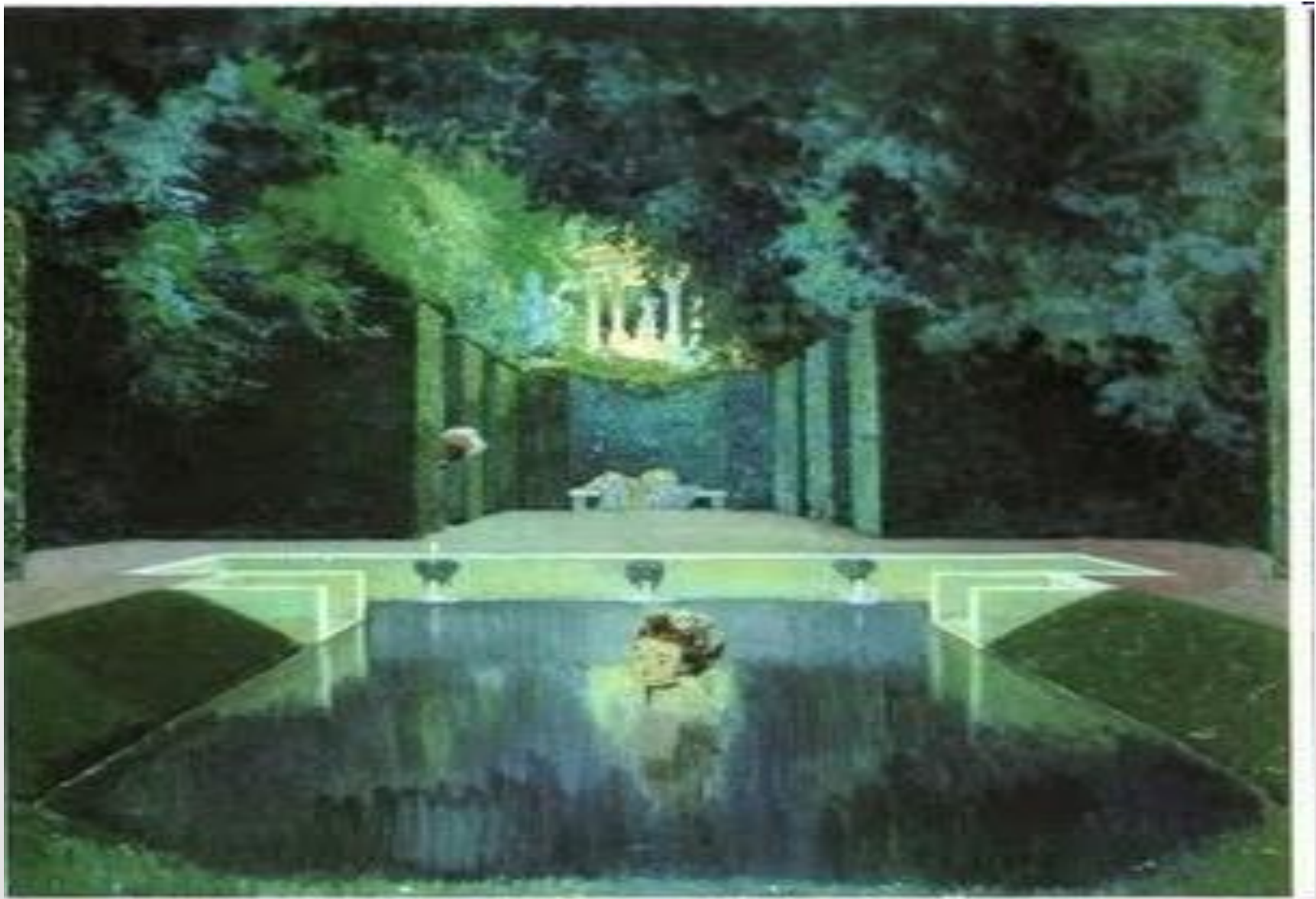
А.Бенуа «Купальня маркизы»