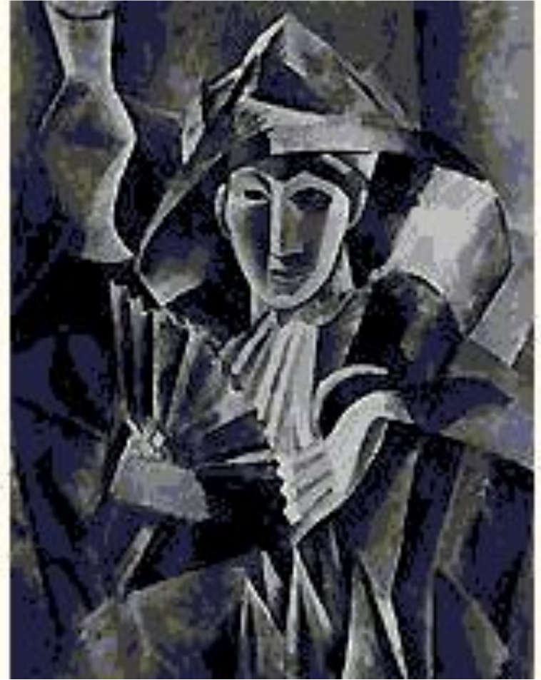
Пабло Пикассо. «Дама с веером»