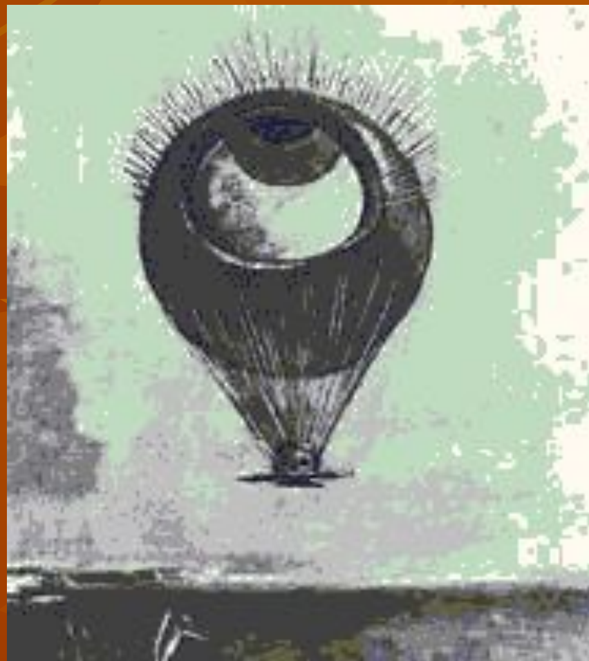
Одilon Редон. «Глаз как шар». Уголь. Около 1890.