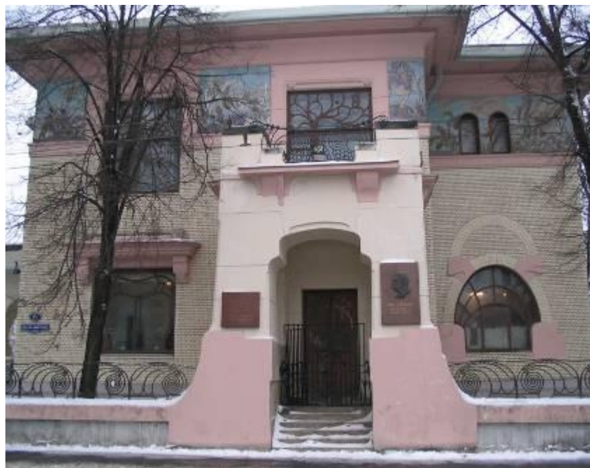
дом Михаила Рябушинского