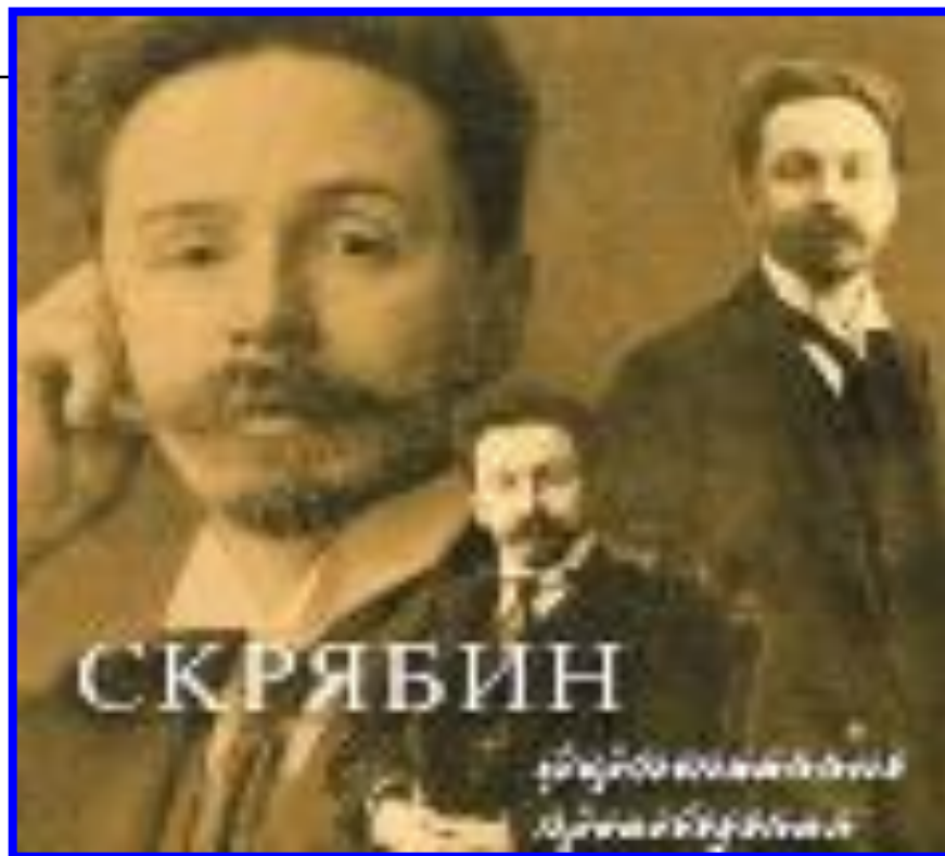
Александр Николаевич Скрябин (1871/72 – 1915)