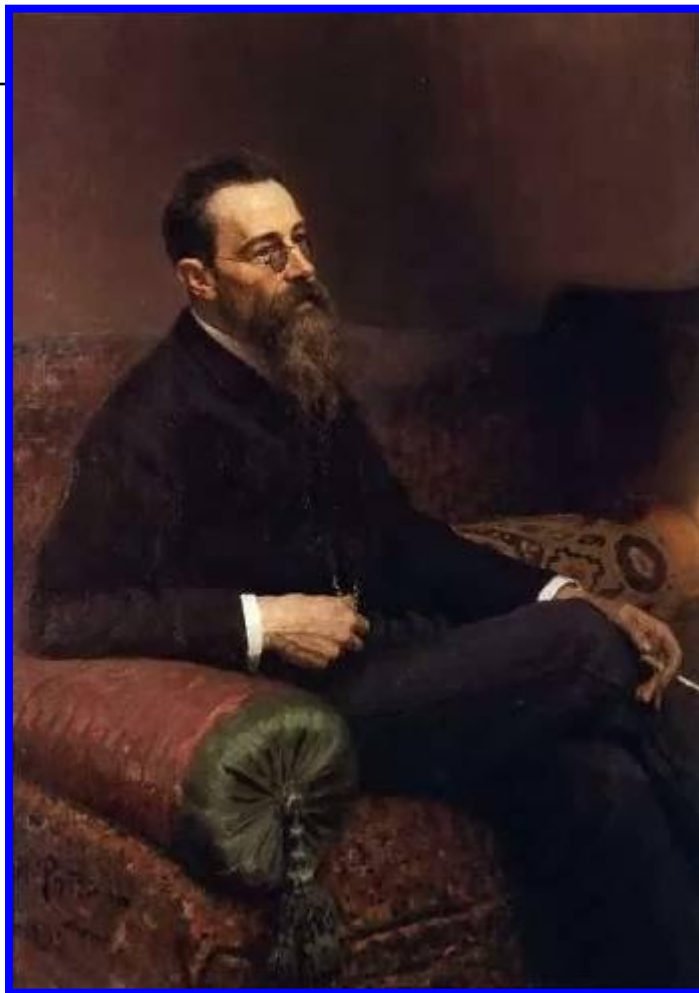
Николай Андреевич Римский-Корсаков (1844-1908)