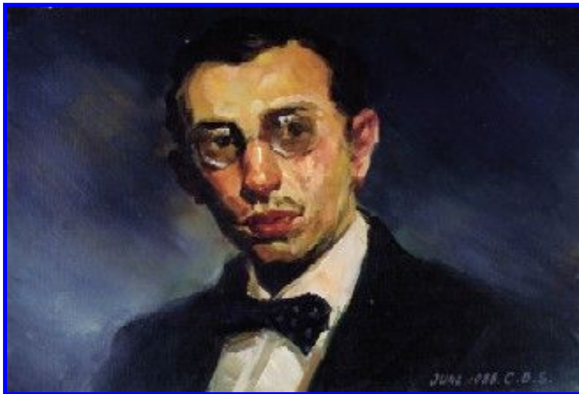
Игорь Федорович Стравинский (1882 – 1971) русский композитор, дирижер