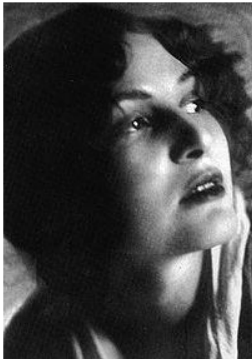
Зинаида Николаевна Райх (21.06.1894 — 15.07.1939) — российская актриса.