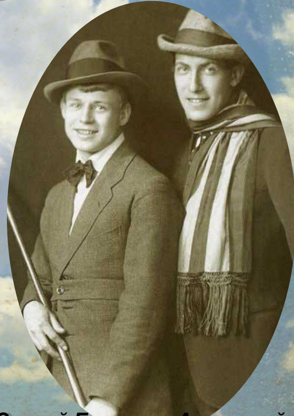
Сергей Есенин и Анатолий Москва, лето. Фото - 1919 год.