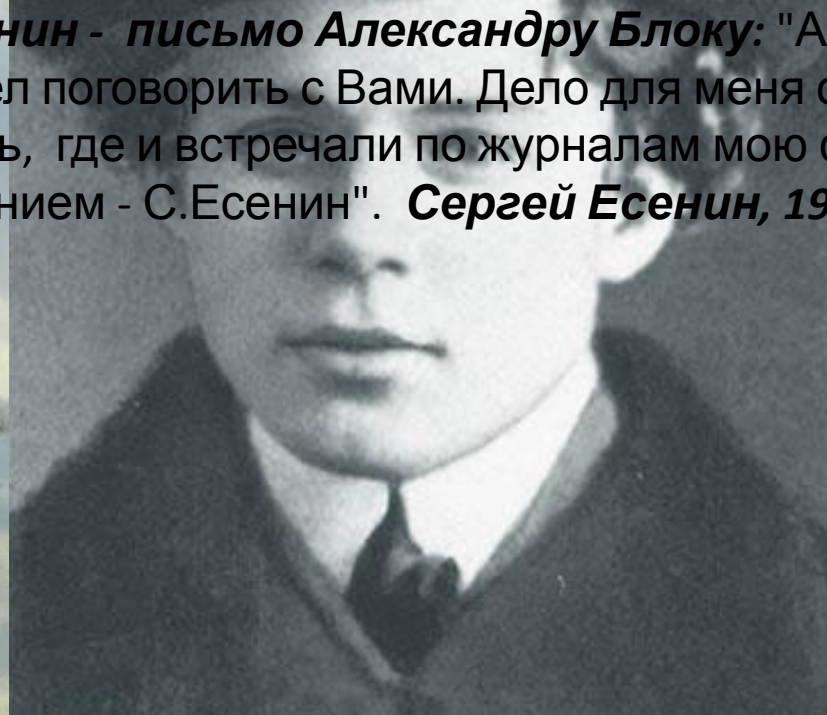
Есенин в возрасте 18 лет

Москва. Сергей Есенин - письмо Александру Блоку: "Александр Александрович! Я хотел поговорить с Вами. Дело для меня очень важное. Вы меня не знаете, а может быть, где и встречали по журналам мою фамилию. Хотел бы зайти часа в 4. С почтением - С.Есенин". Сергей Есенин, 19 лет - 9 марта 1915. Петроград.