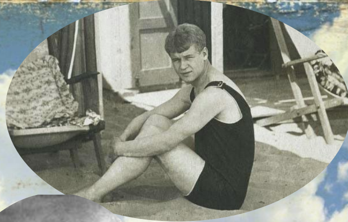
Сергей Есенин. Венеция, Лидо. Фото - 14 августа 1922 год.