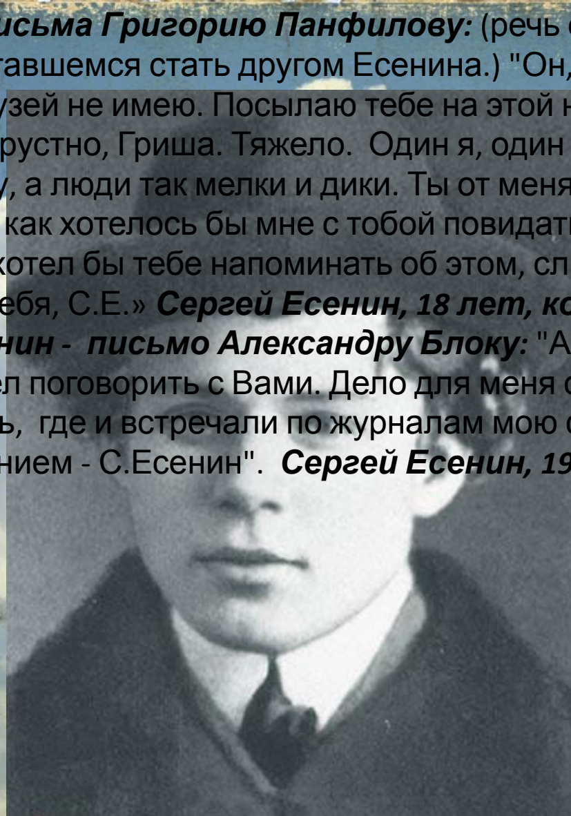
Есенин в возрасте 18 лет

Москва. Сергей Есенин - письмо Александру Блоку: "Александр Александрович! Я хотел поговорить с Вами. Дело для меня очень важное. Вы меня не знаете, а может быть, где и встречали по журналам мою фамилию. Хотел бы зайти часа в 4. С почтением - С.Есенин". Сергей Есенин, 19 лет - 9 марта 1915. Петроград.