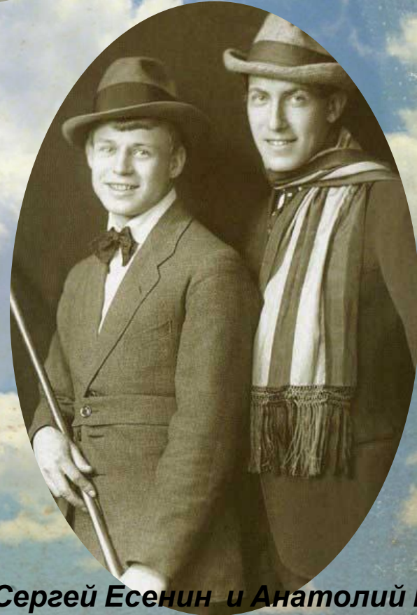
Сергей Есенин и Анатолий Москва, лето. Фото - 1919 год.