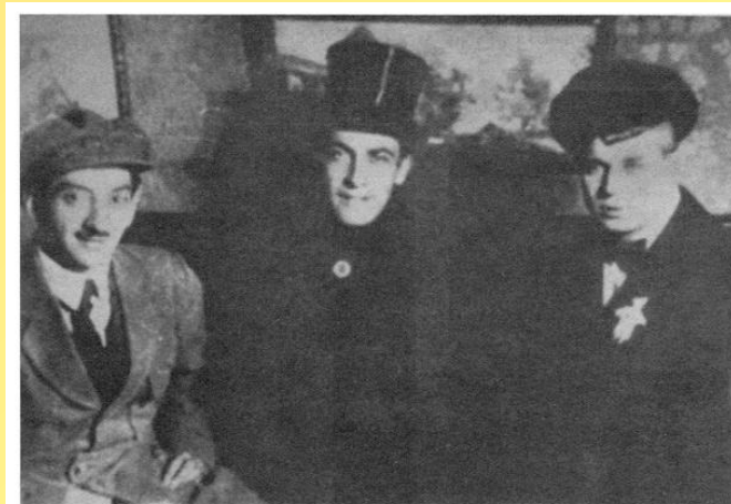
41. С.А.Есенин, А.Б.Мариенгоф, Г.Б.Якулов. 1919.