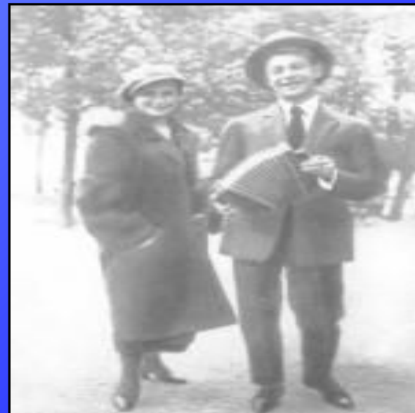
Есенин с сестрой