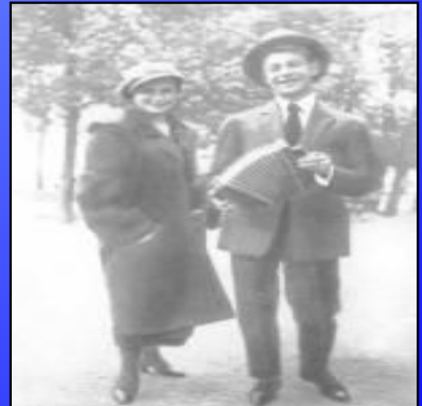
Есенин с сестрой