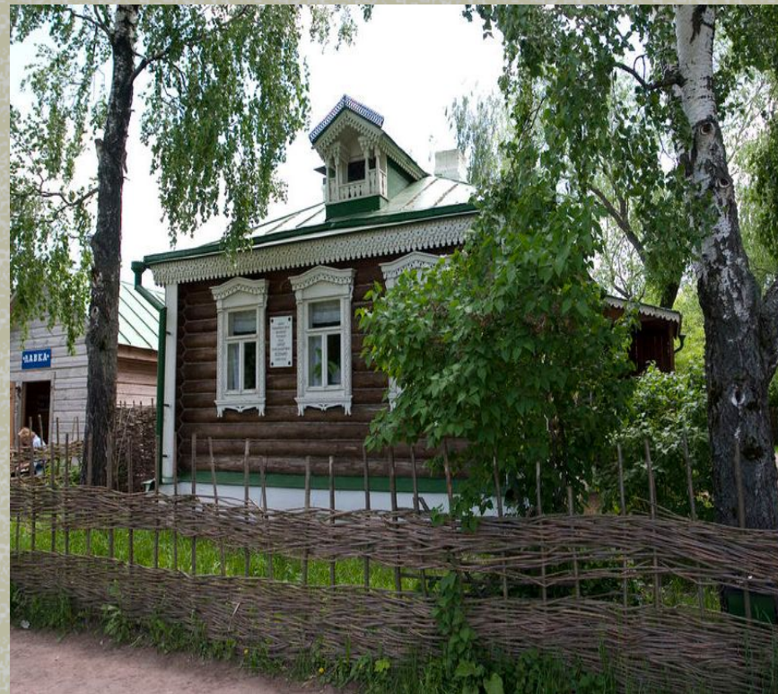
Дом Есенина в Константиново