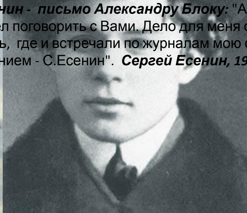
Есенин в возрасте 18 лет

Москва. Сергей Есенин - письмо Александру Блоку: "Александр Александрович! Я хотел поговорить с Вами. Дело для меня очень важное. Вы меня не знаете, а может быть, где и встречали по журналам мою фамилию. Хотел бы зайти часа в 4. С почтением - С.Есенин". Сергей Есенин, 19 лет - 9 марта 1915. Петроград.