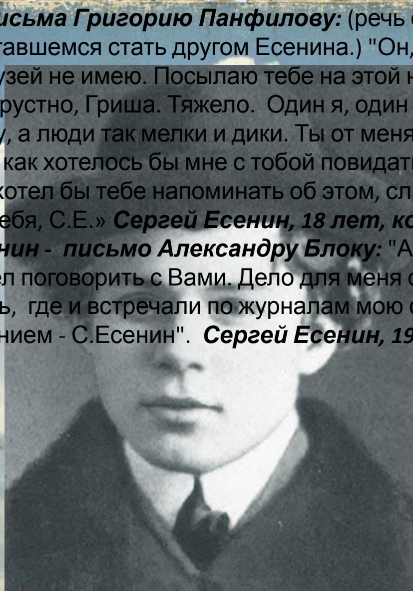
Есенин в возрасте 18 лет

Москва. Сергей Есенин - письмо Александру Блоку: "Александр Александрович! Я хотел поговорить с Вами. Дело для меня очень важное. Вы меня не знаете, а может быть, где и встречали по журналам мою фамилию. Хотел бы зайти часа в 4. С почтением - С.Есенин". Сергей Есенин, 19 лет - 9 марта 1915. Петроград.