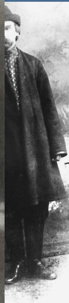
Клюев. 1916 (?).

Из поэтов-современников нравились мне больше всего Блок, Белый и Клюев. Белый дал мне много в смысле формы, а Блок и Клюев научили меня лиричности.