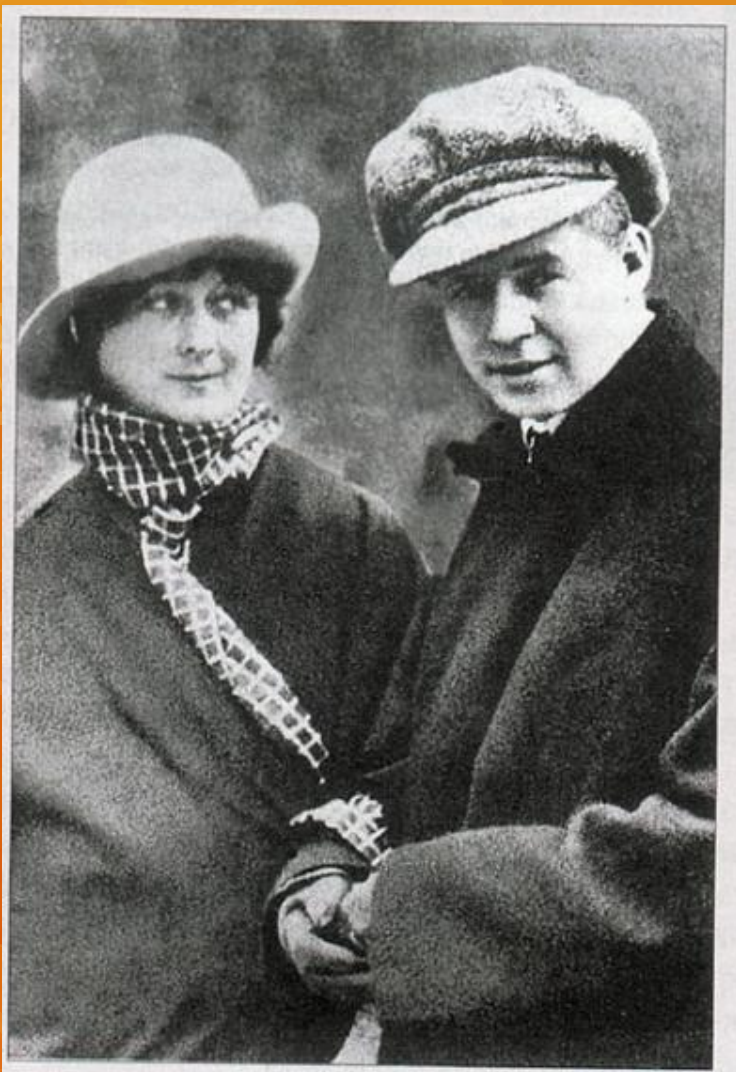
Есенин и Айседора Дункан, 1922