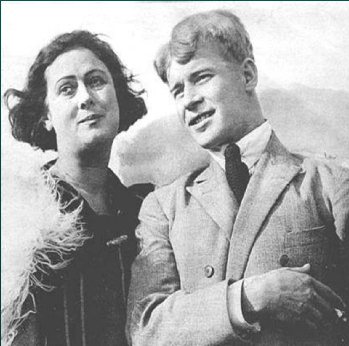
Есенин с танцовщицей Айседорой Дункан