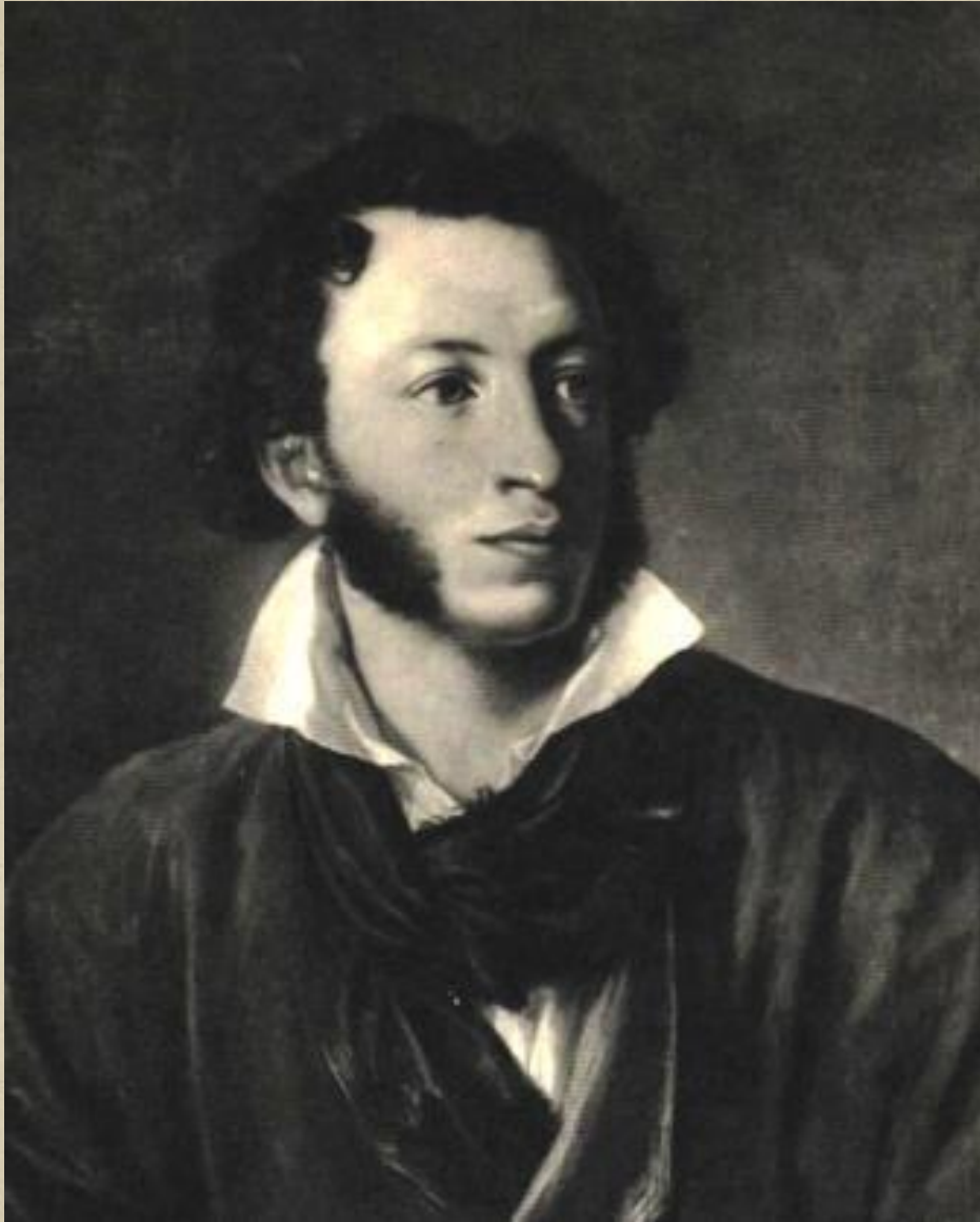
Пушкин Александр Сергеевич