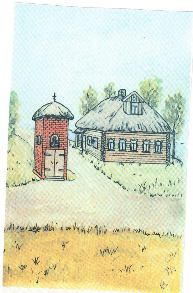
Дом Ф. А. Титова в Матове (село Константиново). Здесь Есенин жил с 1899 по 1904 г. Рисунок сделан А. Д. Панфиловым по рассказам односельчан — сверстников поэта