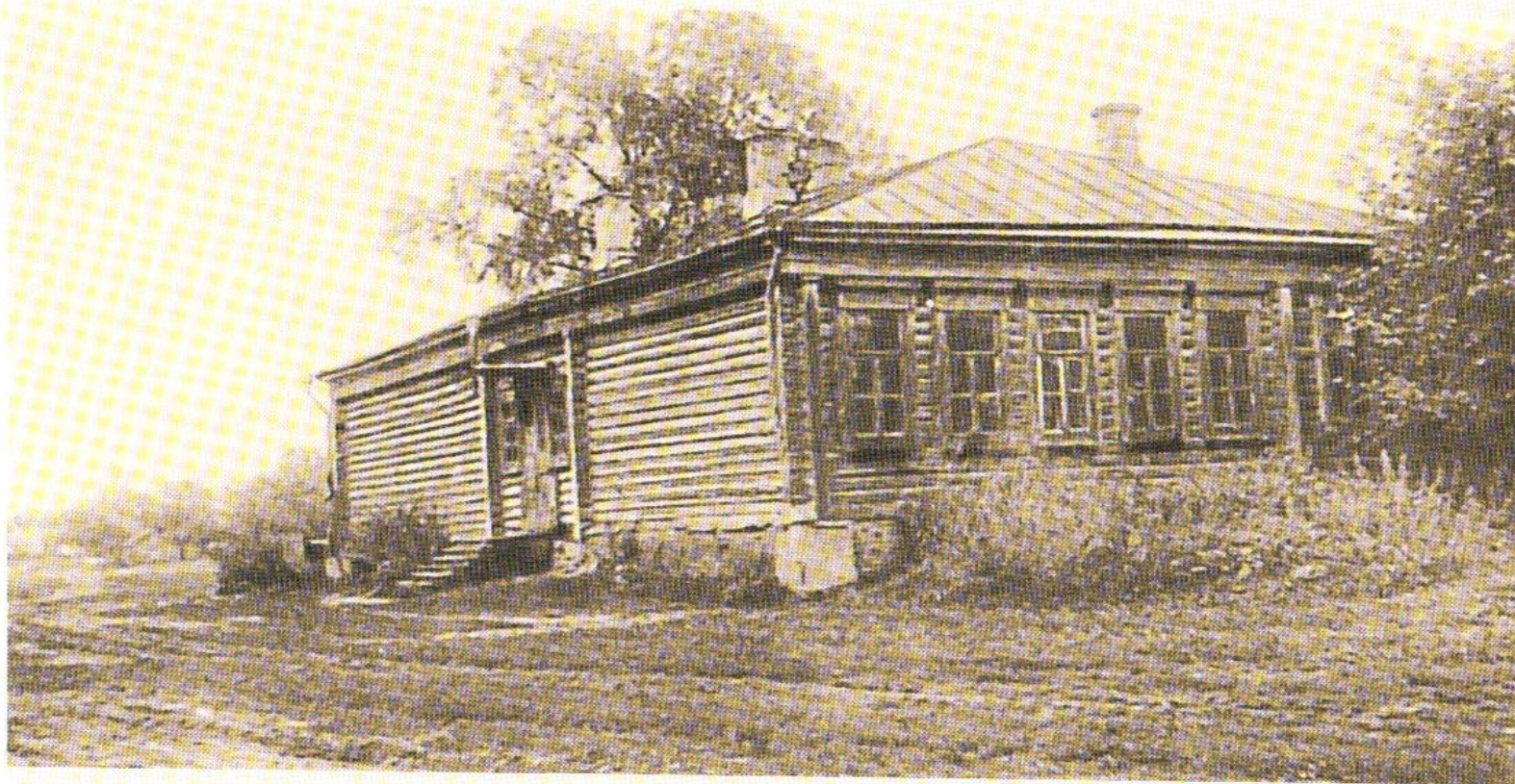
Константиновское земское четырехгодичное училище Фотография

В школе Есенин выделялся не только своим веселым озорным нравом, но и успехами в учебе, а еще и тем, что, как нам было известно, он сам пишет стихи. Занимался он легко, как бы шутя, но по праву считался одним из способных учеников. Окончил он школу с похвальным листом на круглые «пятерки».