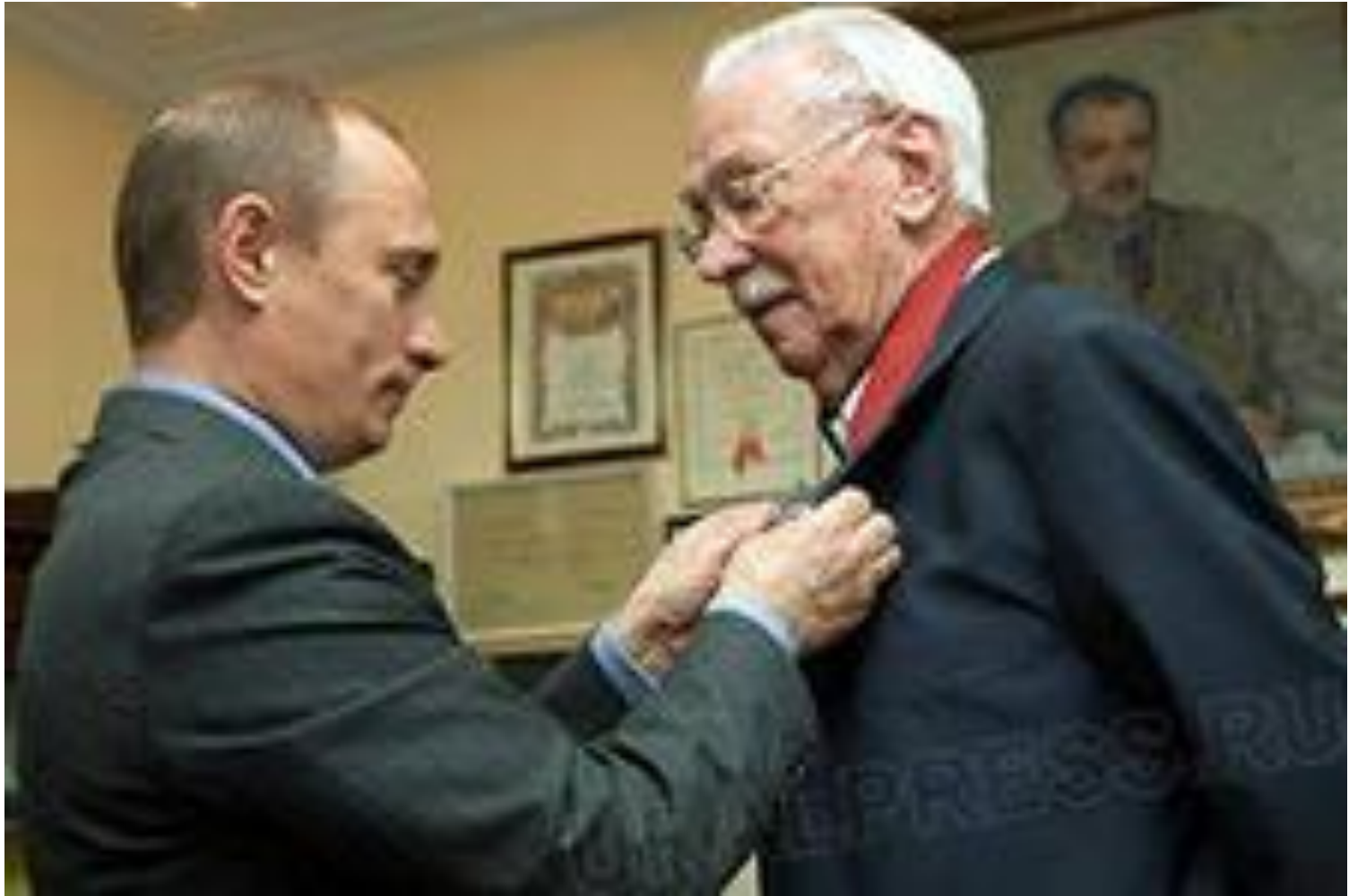
Президент награждает Сергея Михалкова.