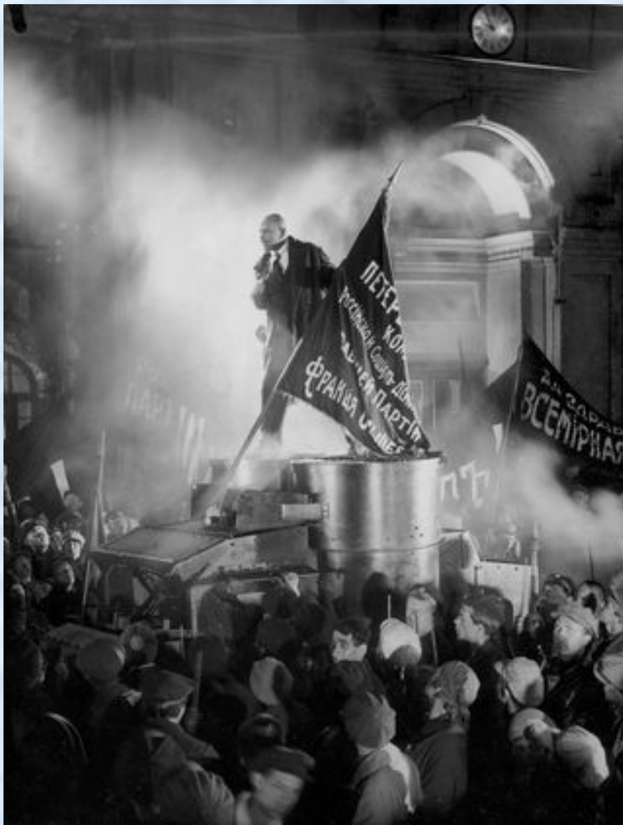
Эйзенштейн — Октябрь (1927)

Историко-революционный фильм, снят к 10-летию Октябрьской революции. События 1917 года, итогом которых стал залп крейсера "Аврора" и штурм Зимнего дворца, были восстановлены с максимальной точностью.