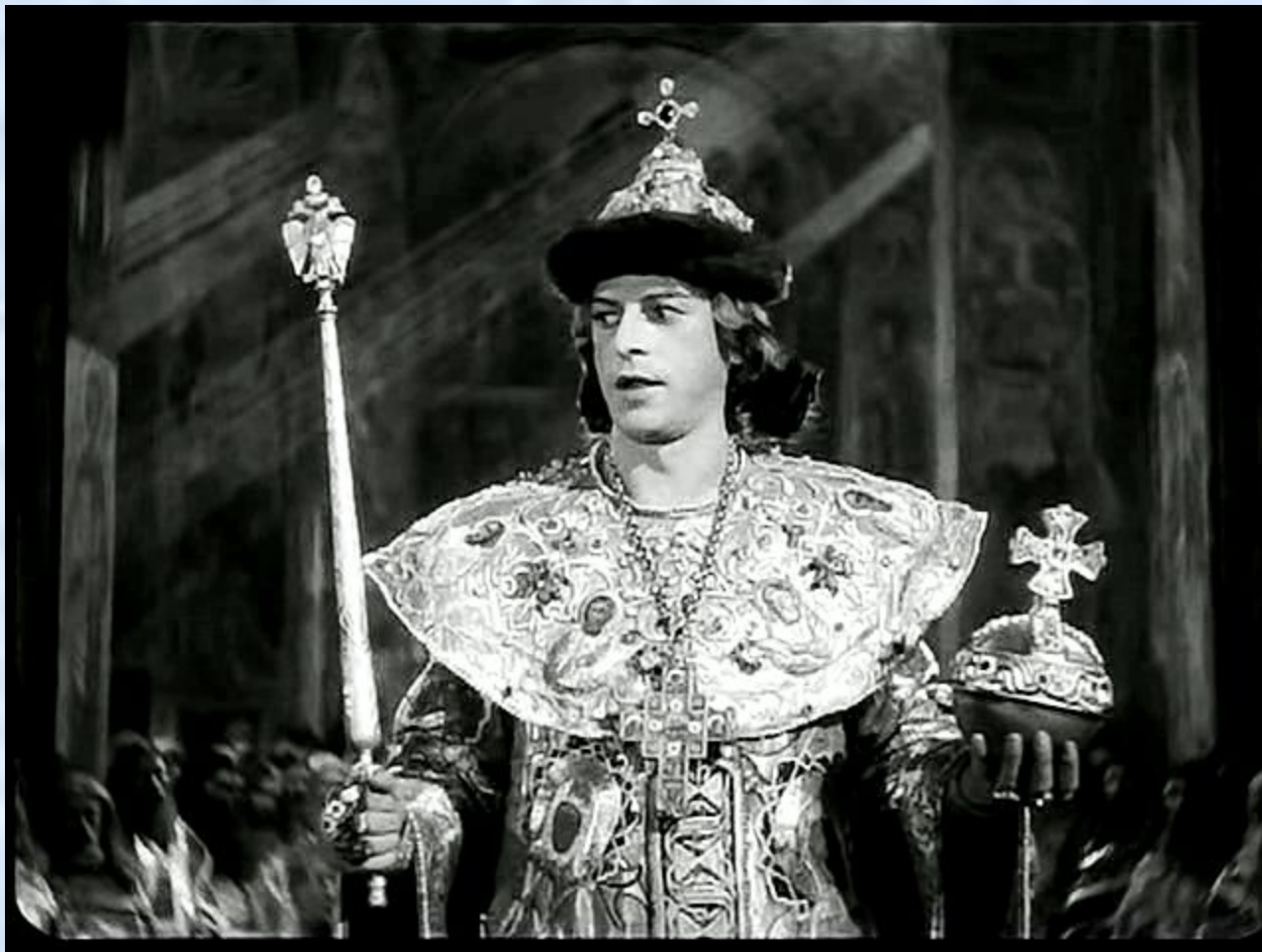
"Иван Грозный" (1944; х/ф, первая часть трилогии "Иван Грозный"; 26 января 1946 года удостоена Сталинской премии первой степени),