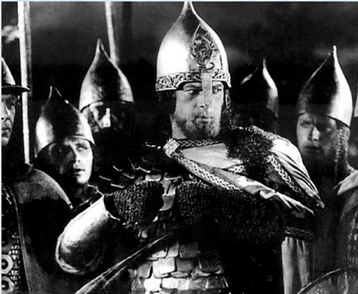
Николай Черкасов в фильме Сергея Эйзенштейна "Александр Невский"