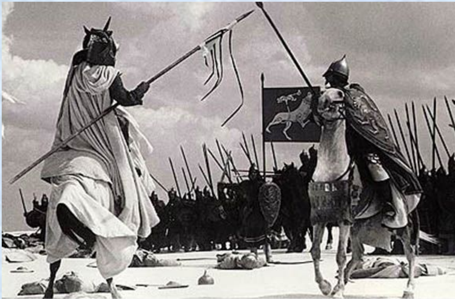
Кадр из фильма "Александр Невский"