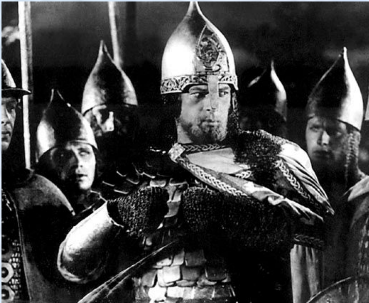
Николай Черкасов в фильме Сергея Эйзенштейна "Александр Невский"