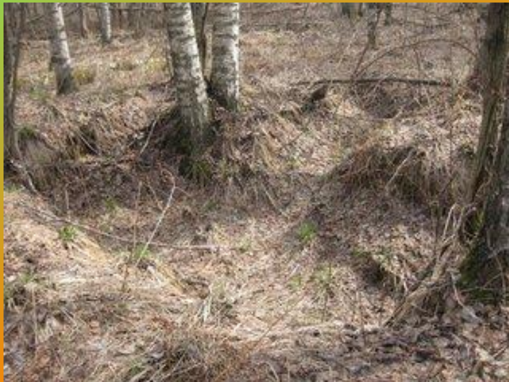
ЯМА ОТ БЛИНДАЖА НА МЕСТЕ СРАЖЕНИЙ

На протяжении всего творческого пути тема войны оставалась для Орлова главной, хотя ею свой поэтический кругозор он не ограничивал. Подобно другим писателям его поколения, Орлов воспринимал войну как наиболее значительное событие собственной жизни.