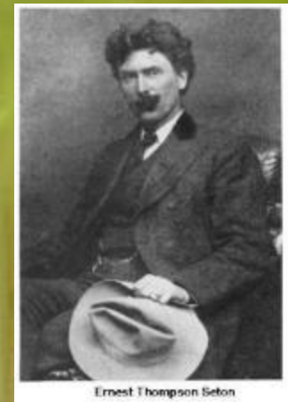
Ernest Thompson Seton

До 1896 года он изучал изобразительное искусство в Лондоне, Париже, Нью-Йорке, после того как в 19 лет уже закончил колледж искусств в Торонто.