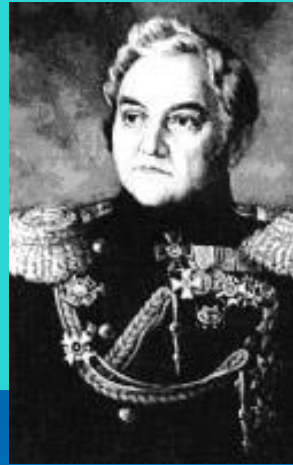
Лазарев Михаил Петрович (3 (14).11.1788. — 11 (23).04.1851).