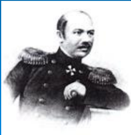
Истомин Владимир Иванович (6(18).03.1809 г. — 7(19).03.1855 г.).