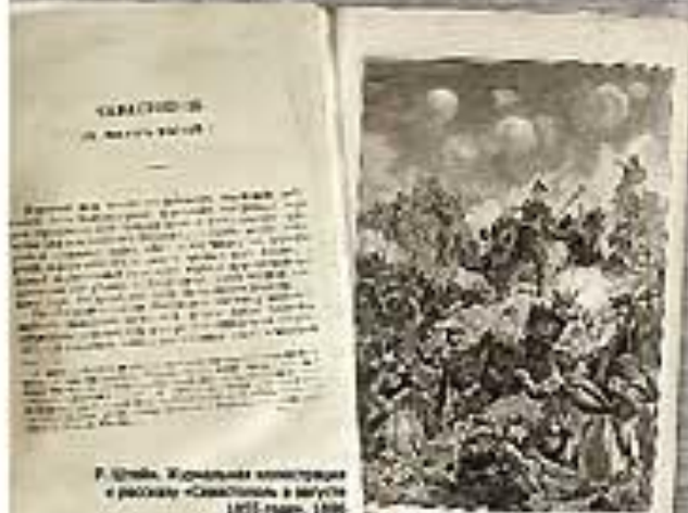
Р. Толстой. Журнальные записки и рассказы «Севастополь в августе 1854 года». 1856

Кавальерия выехала вперед, человек 30 человек в красной доблестной форме. Когда она выехала из-за гряды на открытую площадь, тут послышался бурный шаг гряд, догнать их было невозможно и что они сделали — неизвестно, потому что, не дожидаясь времени ретирады, в толпу начали бить ему уже своим мундиром, красные штаны и шляпы и другие вещи.