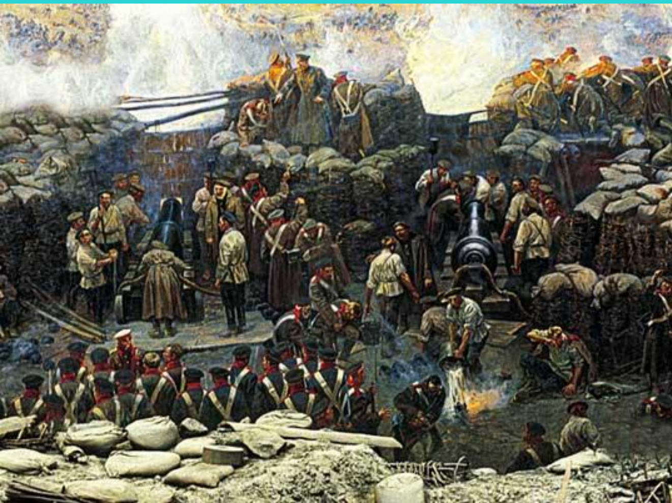
Ф.Рубо. Оборона Севастополя