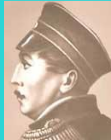
Павел Степанович Нахимов