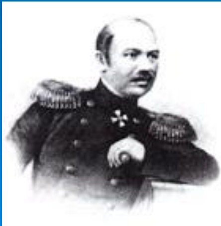
Истомин Владимир Иванович (6(18).03.1809 г. — 7(19).03.1855 г.).