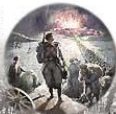
А. АНОН. Огневые рассказы из Севастополя. 1854