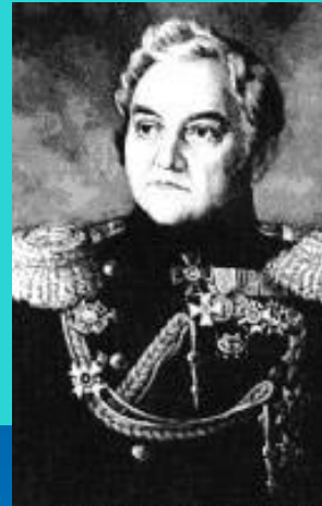
Лазарев Михаил Петрович (3 (14).11.1788. — 11 (23).04.1851).