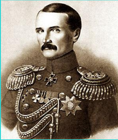
Корнилов Владимир Алексеевич (13 февраля 1806 года — 17(5) октября 1854 года).