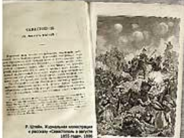
Р. Додлига. Журналистская иллюстрация в рассказе «Севастополь в августе 1915 года». 1916