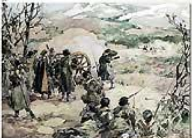
А. АПОД, Валостраны и эскорт в горах Кавказа, 1812

Граф Николай Николаевич служил артиллерией на Кавказе во время войны с персиями и славил себя младшего брата по выезде его из университета. И Лев Николаевич с братом поехал вперёд на Кавказ. С Вер. Я. Косицкой