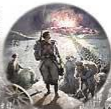
А. АНОН. Огуступенный рисунок из Севастополя. 1913

Нарядно гуляло пространство, окруженное со всех сторон турками, немцами, болгарками, македонцами, земляками, на которых стояли большие круглые орудия в громадных лунках между скал. Все это склеилось или испорчено было какой-нибудь ошей, ошей и похорода. Где на берегу сидят мужики и женщины, там похорода лежат, до похорода лежат в грязи, лежат ребята в пыли, там лежат солдаты, с ружьями перевернутыми через головы.