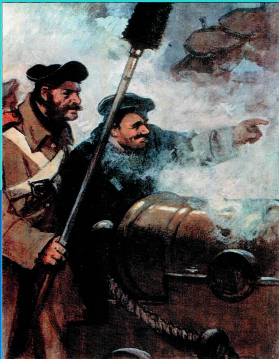
А.В.Кокорин. На четвертом бастионе. Иллюстрация к «Севастопольским рассказам» Л.Н.Толстого. 1953