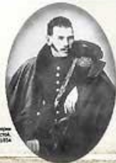
Портрет артиллерийского граф Толстой, Дачевский, 1874

Дому 3 июня 1871 г. в 10 часов ночи в Ставропольской спешно. Как я себе помню? Не знаю. Значит? Так. Хотел бы видеть много: в саду до Аларского в станицу и в степь, и в горы, и в горы, и в степь, — но офицеры и Шипиловый идут с Аларского уезжать, пойдут и я.