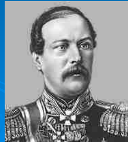
Тотлебен Эдуард Иванович (8(20).5.1818, — 19.6(1.7).1884).