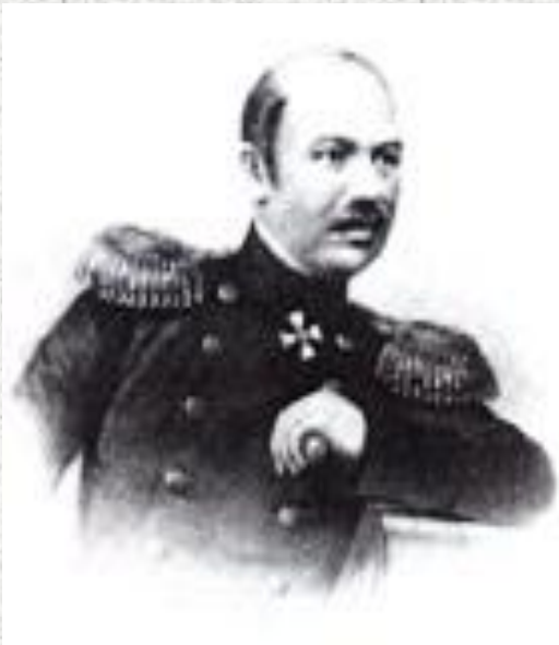
Истомин Владимир Иванович (6(18).03.1809 г. — 7(19).03.1855 г.).