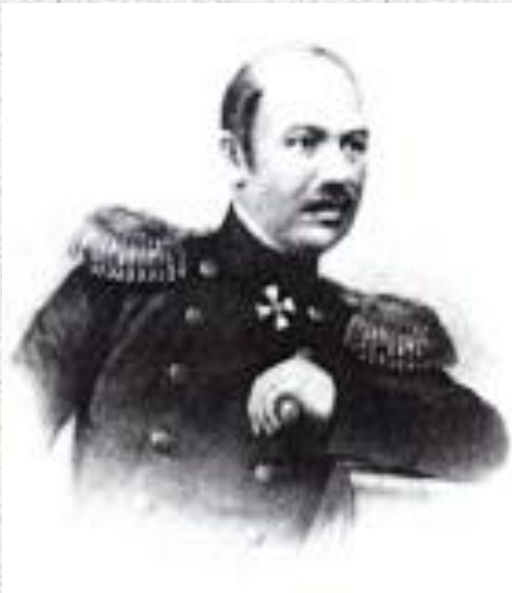
Истомин Владимир Иванович (6(18).03.1809 г. — 7(19).03.1855 г.).