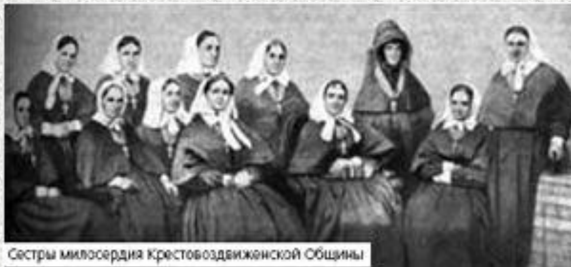
Сестры милосердия Крестовоздвиженской Общины