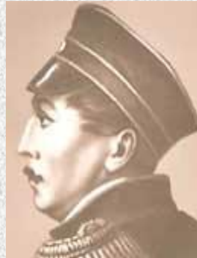
Павел Степанович Нахимов (23 июня (05.07)1802 - 30 июня (12.07) 1855)