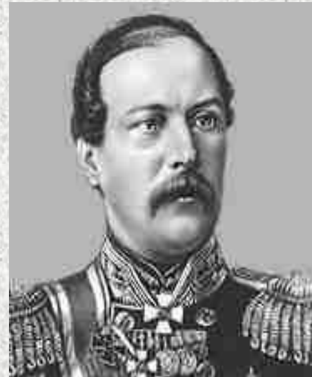
Тотлебен Эдуард Иванович (8(20).5.1818, — 19.6(1.7).1884).