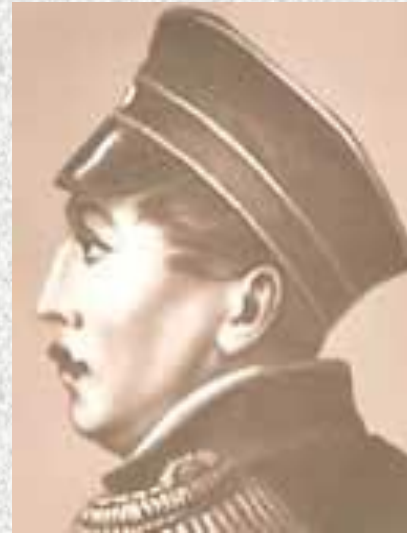
Павел Степанович Нахимов (23 июня (05.07)1802 - 30 июня (12.07) 1855)