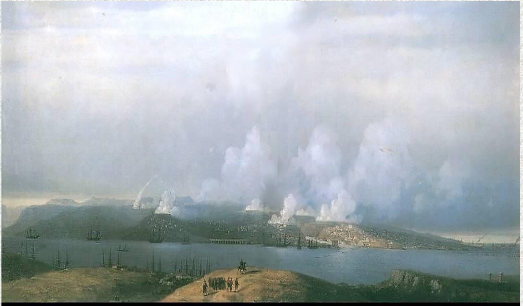
И.К. Айвазовский «Осада Севастополя»