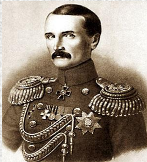
Корнилов Владимир Алексеевич (13 февраля 1806 года — 17(5) октября 1854 года).