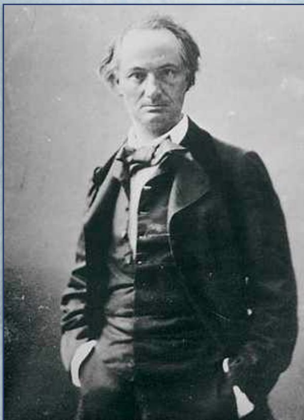
ШАРЛЬ П'ЄР БОДЛЕР CHARLES PIERRE BAUDELAIRE

“БОДЛЕР... ЦЕЙ КОРОЛЬ ПОЕТІВ, СПРАВЖНІЙ БОГ” АРТЮР РЕМБО