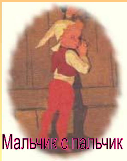
Мальчик с пальчик

На русском языке сказки Перро впервые вышли в Москве в 1768 году под названием "Сказки о волшебницах с нравоучениями", причем озаглавлены они были вот так: "Сказка о девочке с красненькой шапочкой", "Сказка о некотором человеке с синей бородой", "Сказка о батюшке котике в шпорах и сапогах", "Сказка о спящей в лесу красавице" и так далее. Потом появились новые переводы, выходили они в 1805 и 1825 годах. Скоро русские дети, также как и их сверстники в других странах, узнали о приключениях Мальчика с пальчик, Золушки и Кота в сапогах. И сейчас нет в нашей стране человека, который не слышал бы о Красной Шапочке или о Спящей красавице.