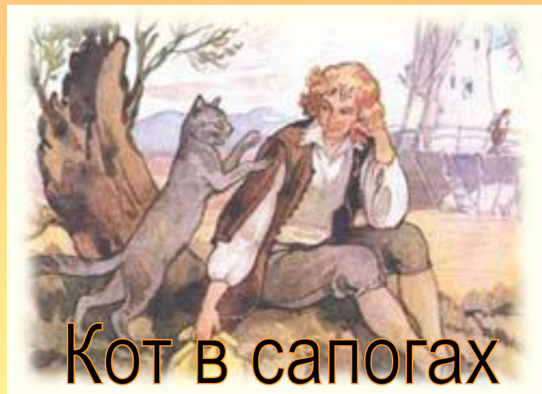
Кот в сапогах