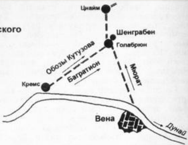
Схема Аустерлицкого сражения