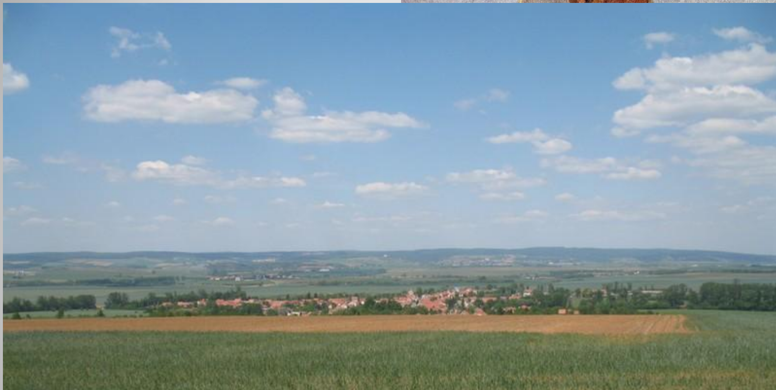
Небо Аустерлица 1, 3, XIX