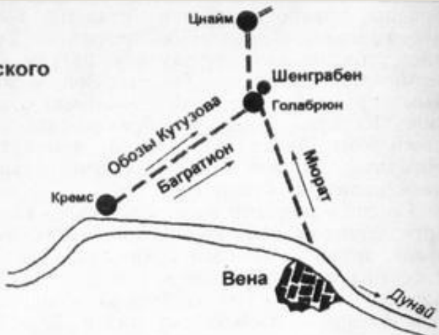
Схема Аустерлицкого сражения