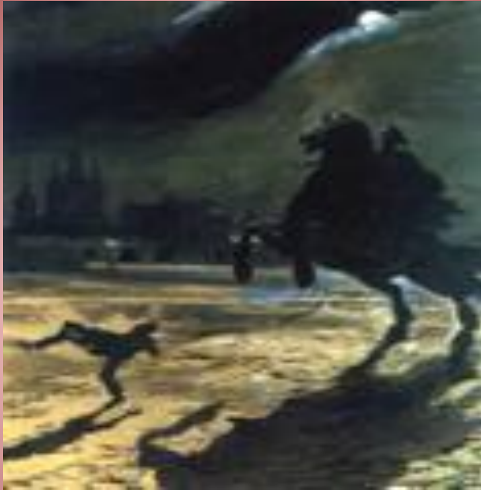
А.С Пушкин «Медный всадник».