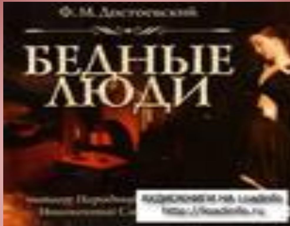
Ф.М. Достоевский «Бедные люди». Титульный лист романа.