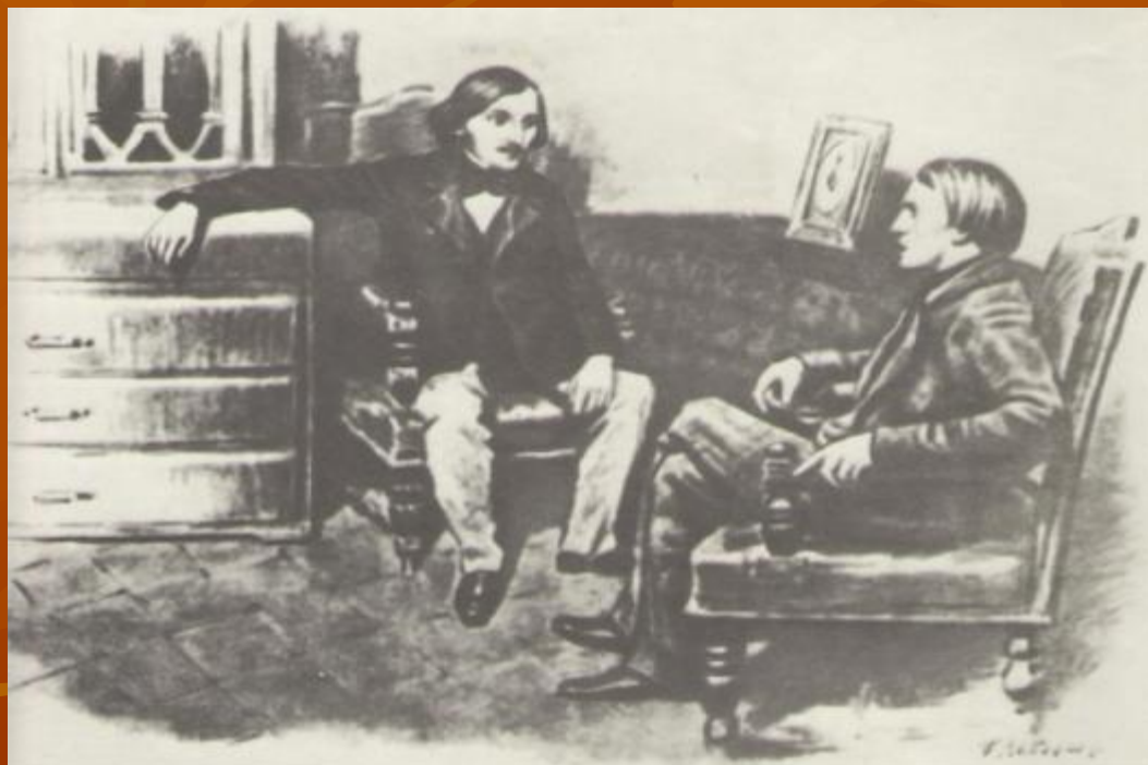
82. В. Г. Белинский и Н. В. Гоголь