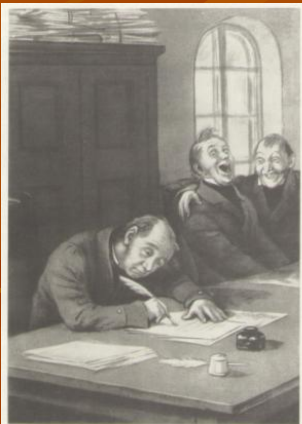
69. Акакий Акакиевич в департаменте Художники Курьянцы, 1952 г., 6., черная акварель