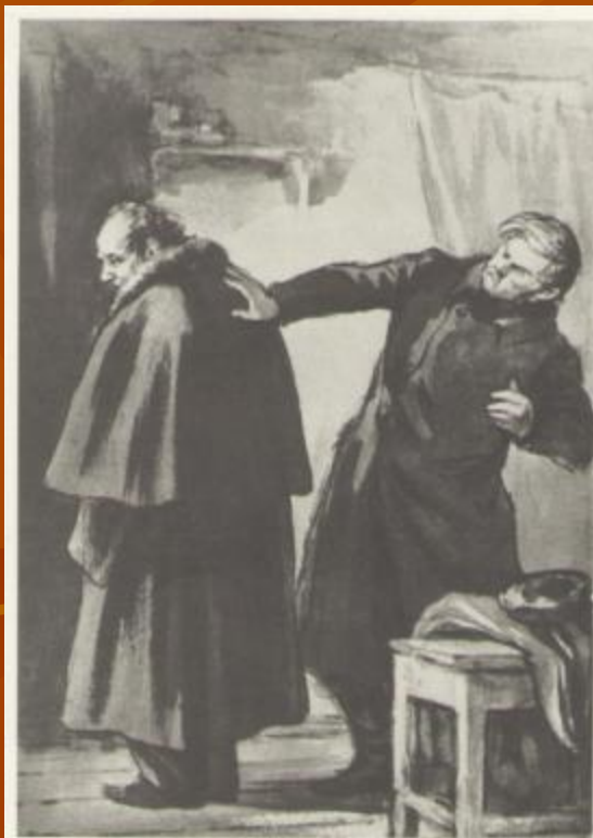
70. Ахилей Ахилевич примеряет новую шинель

Художник Кукрыники, 1952 г., б., черная оловяная