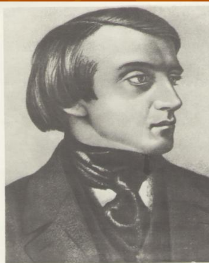
81. Портрет В. Г. Белинского