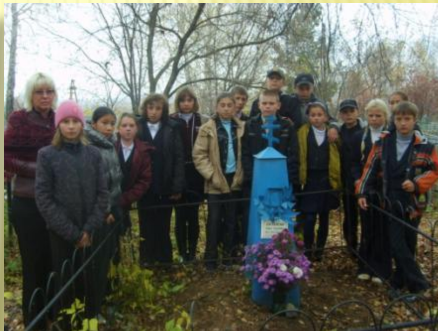
Ребята, занимающиеся краеведением у могилы дяди В. М. Шукшина