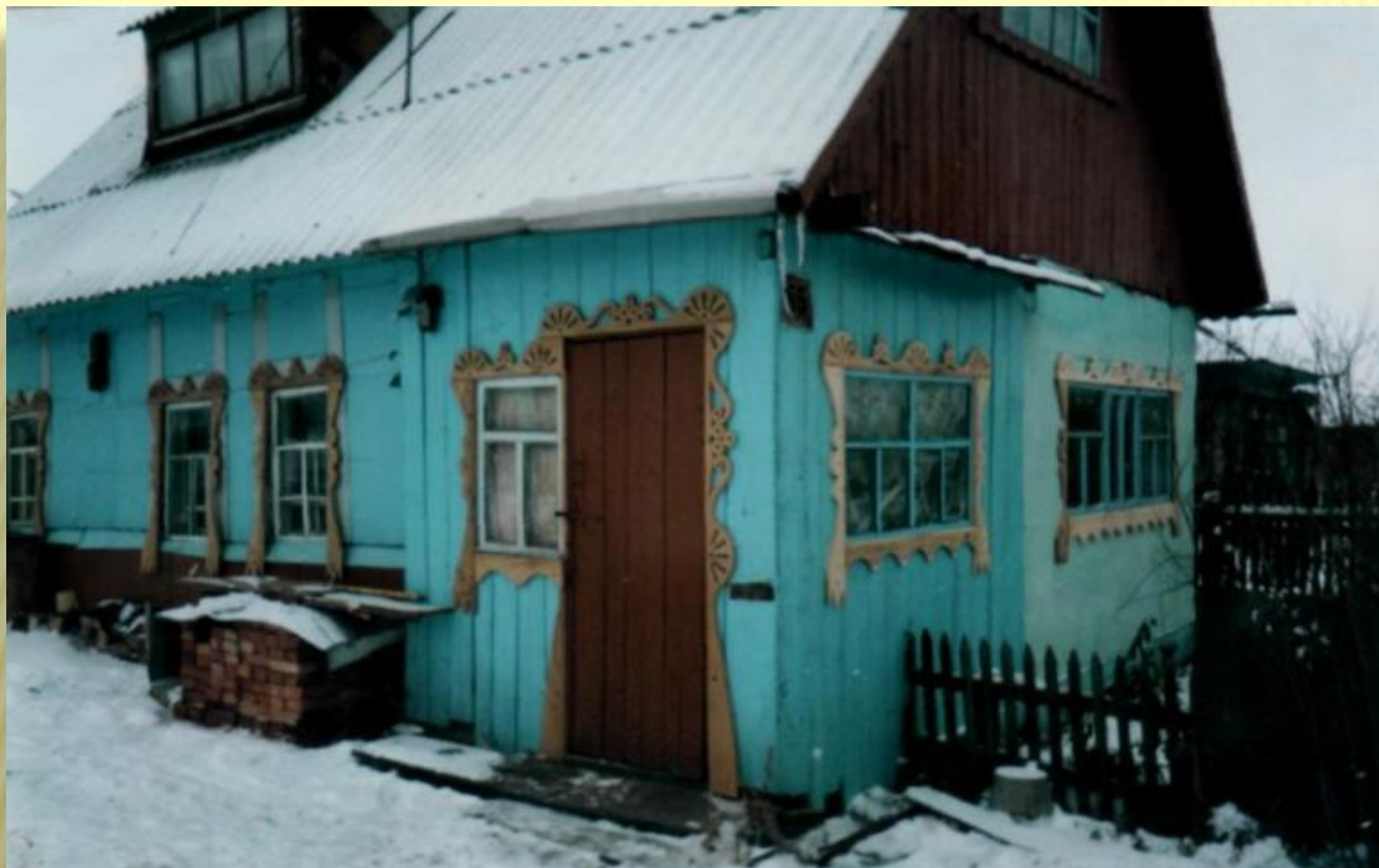
Дом в котором жил дядя В. М. Шукшина в селе Ая