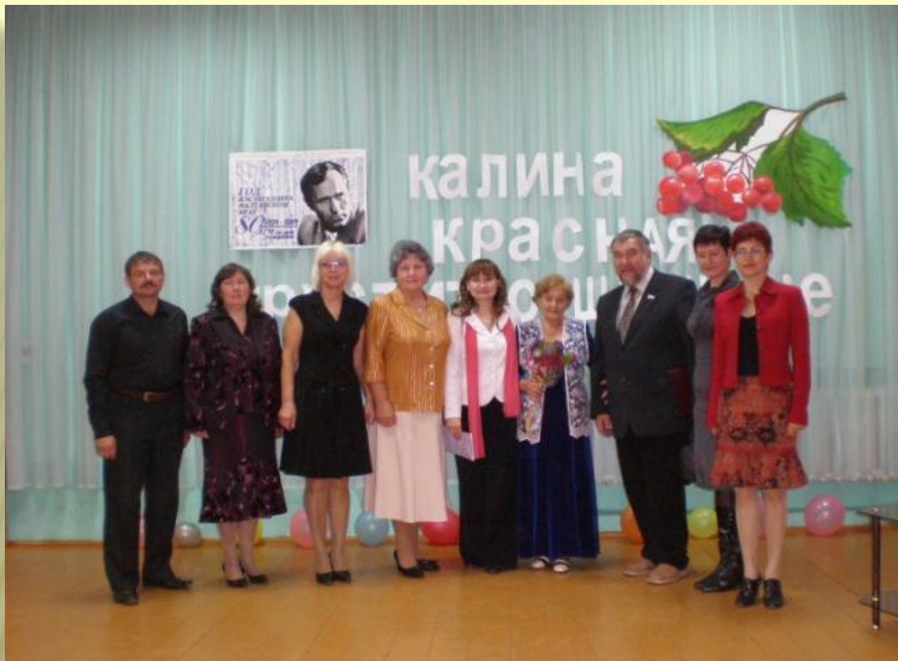
Праздник, посвященный 80-летию В. М. Шукшина «Калина красная грустит о Шукшине»