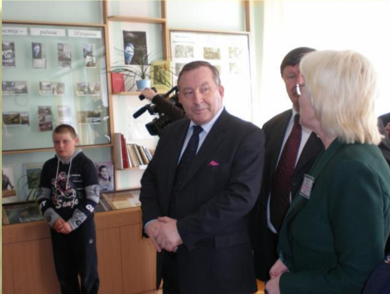
Губернатор Алтайского края А. Б. Карлин в кабинете-музее В. М. Шукшина