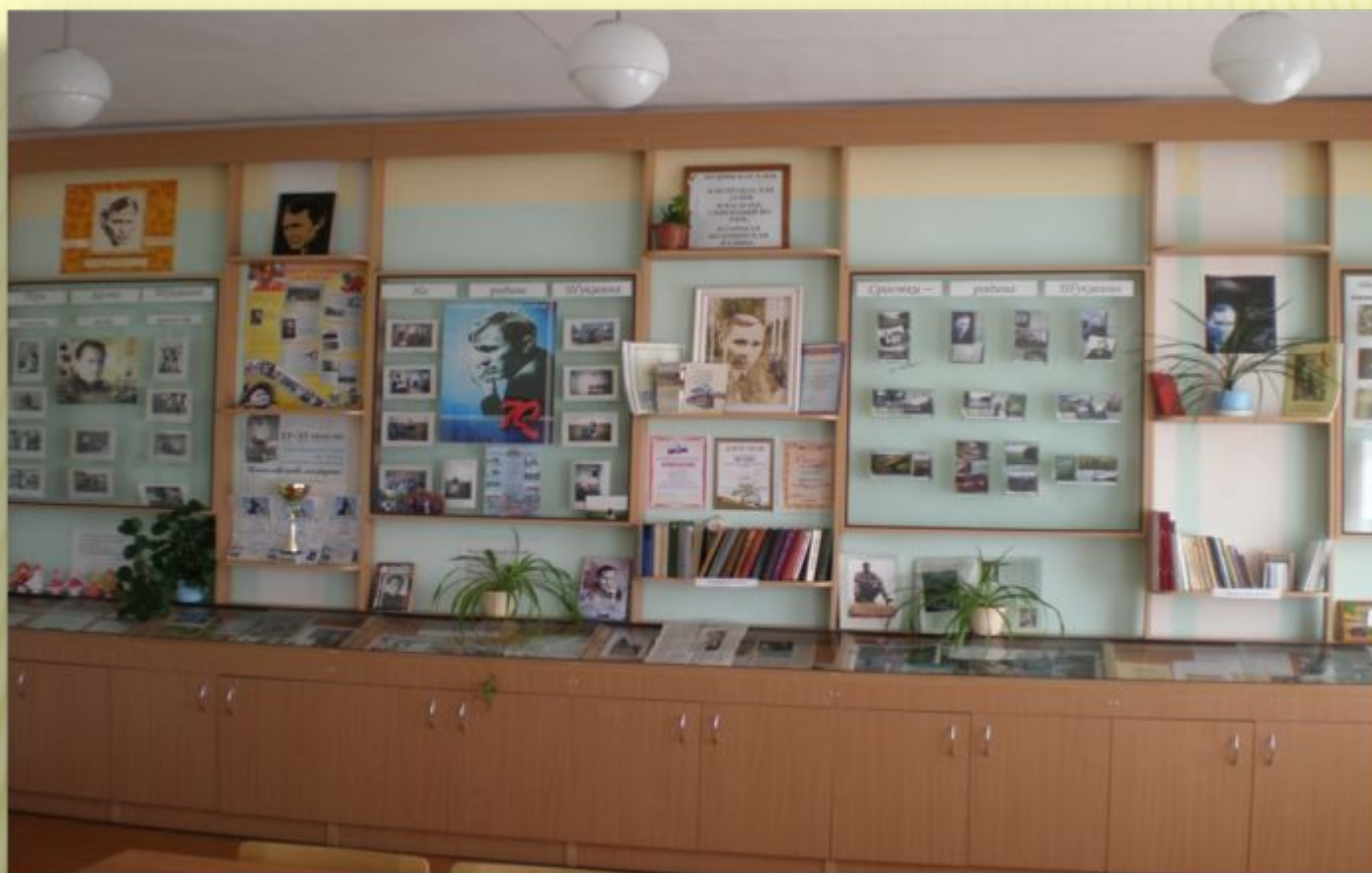
Кабинет-музей В. М. Шукшина в Айской школе