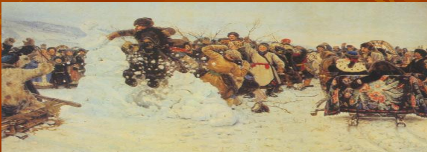
"Взятие снежного городка" Василий Суриков.