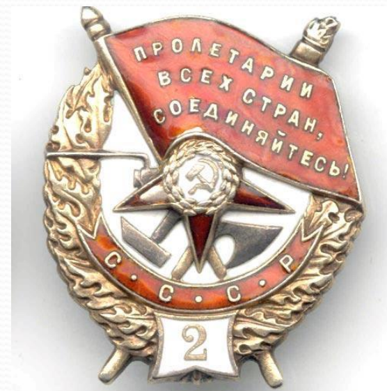
Орден Красного Знамени