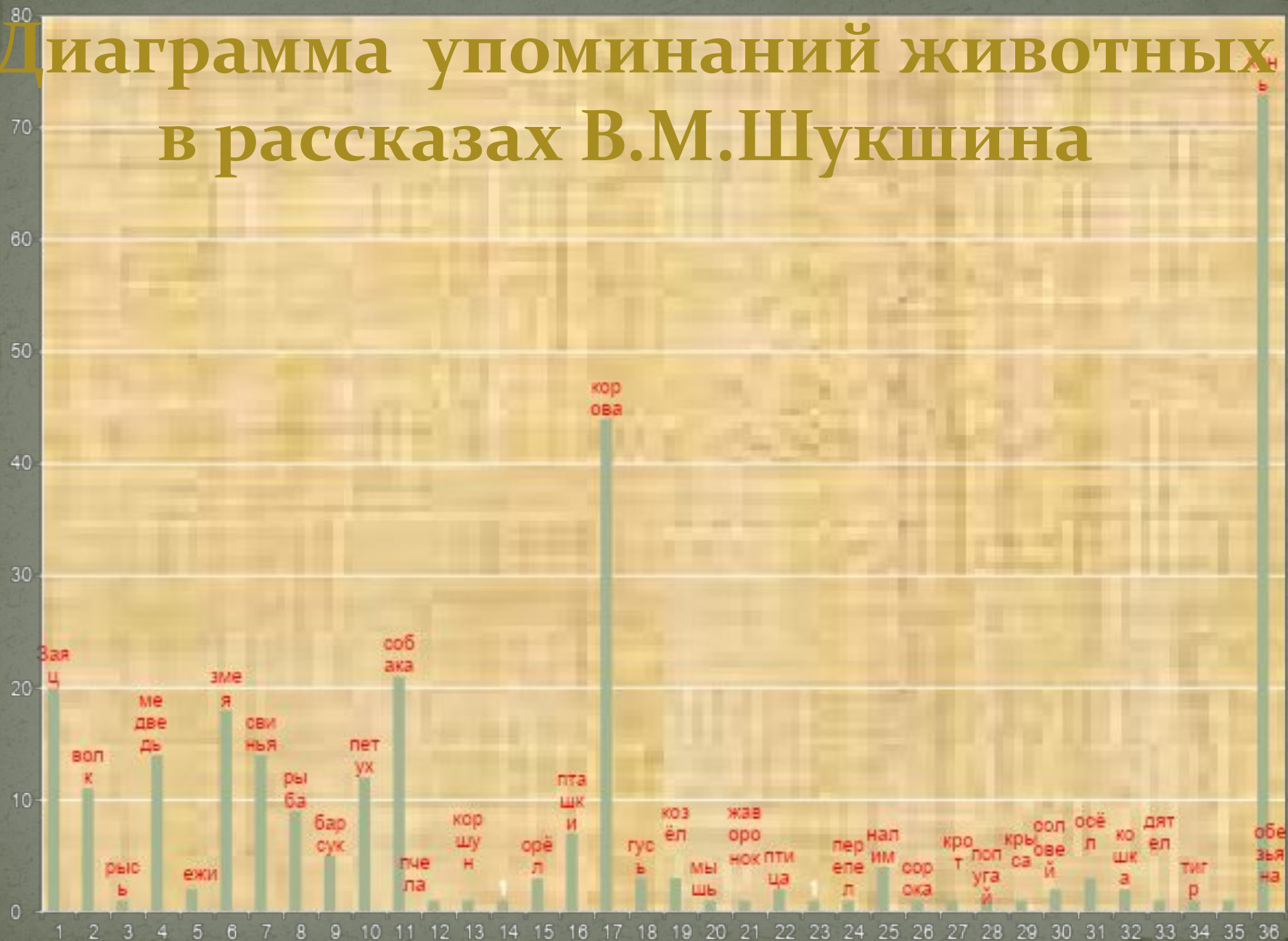
Диаграмма упоминаний животных в рассказах В.М.Шукшина