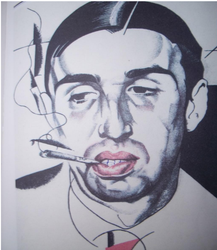
ПОРТРЕТ В.ИВАНОВА.1921 Г.ХУДОЖНИК Ю. АННЕНКОВ