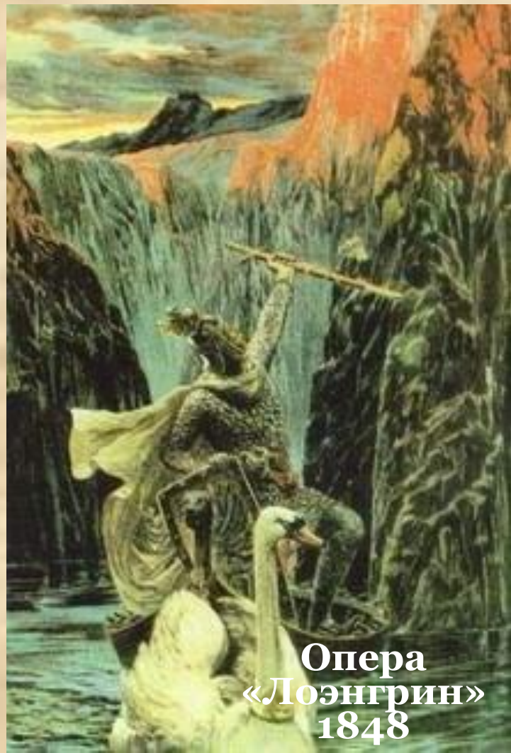
Опера «Лоэнгрин» 1848