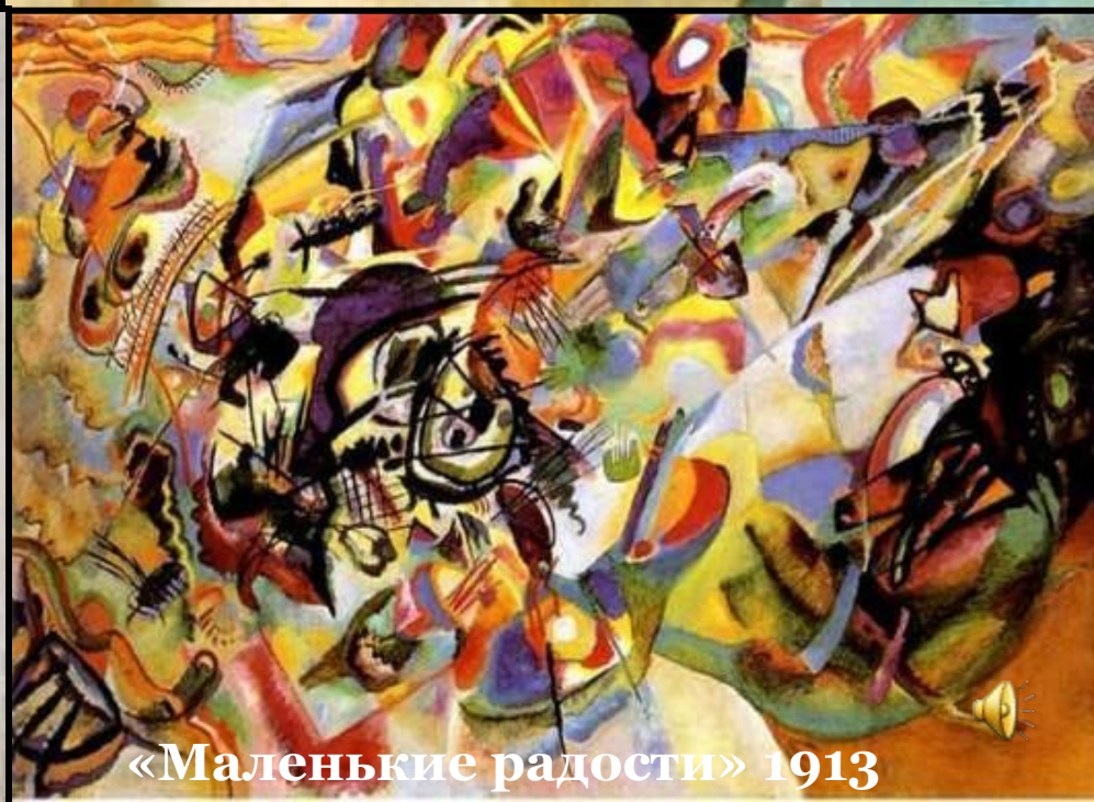
«Маленькие радости» 1913