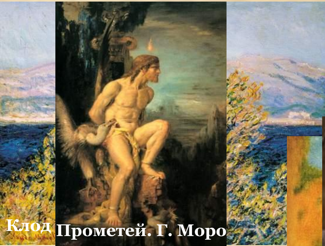
Клод Прометей. Г. Моро

Чем можно объяснить стремление художников уйти от конкретной формы?