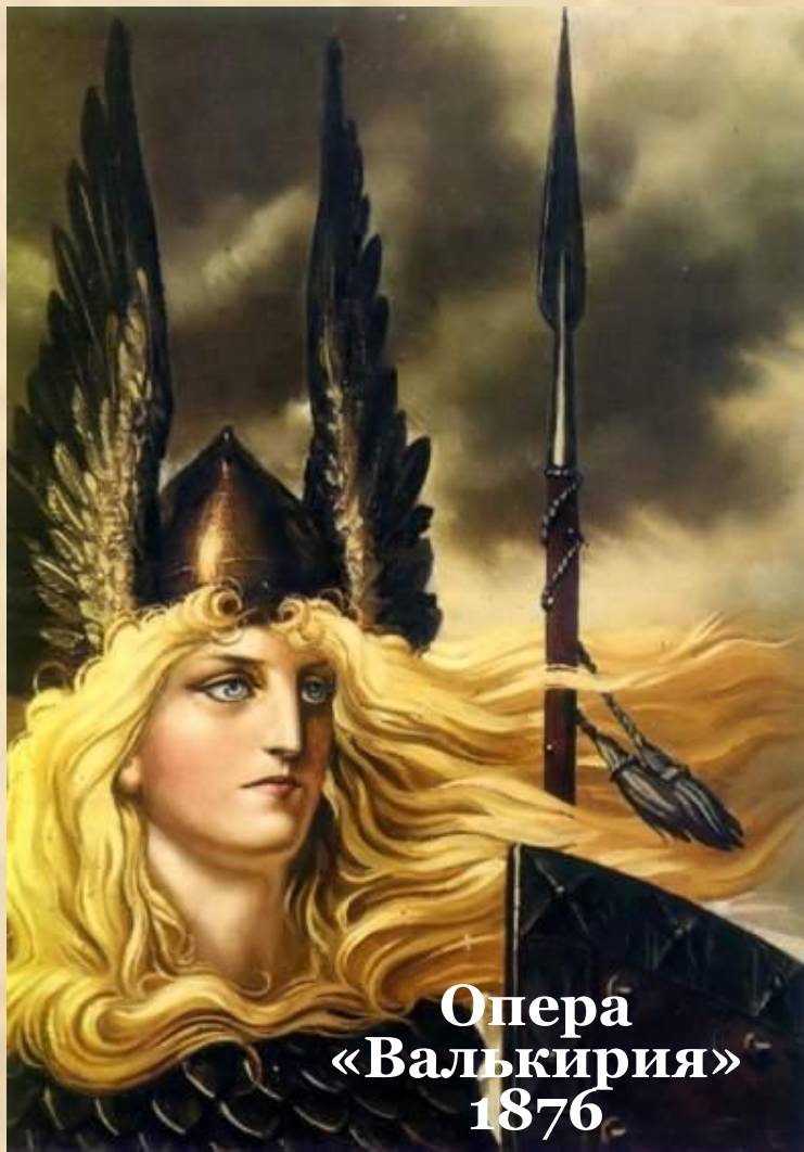
Опера «Валькирия» 1876