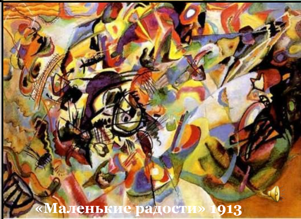
«Маленькие радости» 1913