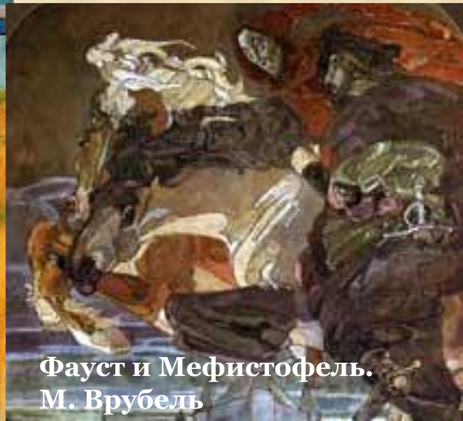
Фауст и Мефистофель. М. Врубель

Почему художники обращаются к аллегории или сюжетам вне времени?