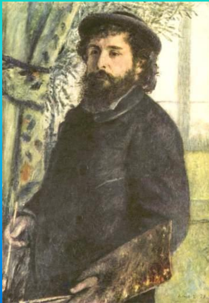
Клод Моне (1840-1926)