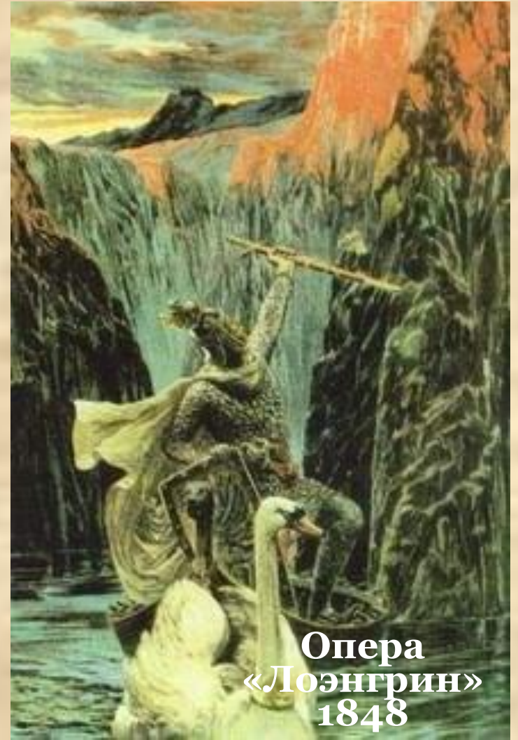
Опера «Лоэнгрин» 1848